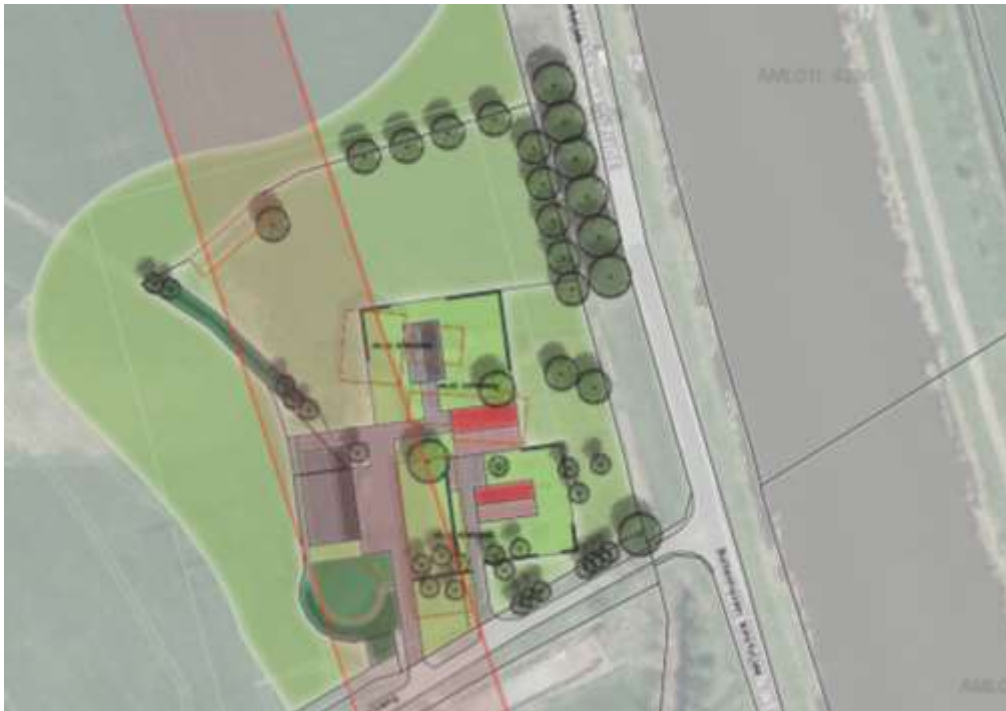
Verbeelding van het wenselijke nieuwe eindbeeld.

Het voornemen bestaat om alle op het erf aanwezige bebouwing te slopen, met uitzondering van de kapschuur. Vervolgens worden twee vrijstaande woningen in het plangebied gebouwd. De extra woning, krijgt een eigen ontsluitingsweg naar de Stokkelersweg. Vermoedelijk wordt een deel van de aanwezige erfbeplanting gerooid. Het nieuwe erf wordt nadien landschappelijk ingepast door middel van de aanplant van erfbeplanting. Op onderstaande afbeelding wordt een verbeelding van het wenselijke eindbeeld weergegeven.