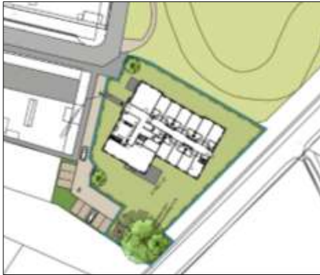
Verbeelding van het wenselijk eindbeeld (bron: Weusten Liedenbaum Architecten).

Het voornemen bestaat om het bestaande pand te slopen en vervangende nieuwbouw van zorgwoningen te realiseren. Deze woningen komen in één gezamenlijk pand. Aangenomen wordt dat de strook met ruigte verwijderd wordt en dat de erfverharding verwijderd en vervangen wordt. Tevens wordt er aangenomen dat er nieuwe erfverharding wordt aangelegd. Op onderstaande afbeelding wordt een plattegrond van het wenselijk eindbeeld weergegeven.