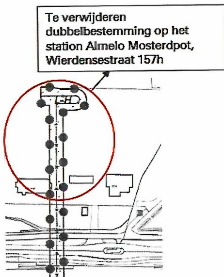
Figuur 1 Verbeelding ontwerpbestemmingsplan

Tennet B.V. heeft bij de verdere uitwerking van haar plannen geconstateerd dat de aansluiting van de extra hoogspanningsverbinding op het verdeelstation Almelo Mosterdpot ter hoogte van de Wierdensestraat 157h in Almelo tegen een technische belemmering aanloopt. Dit in verband met beoogde toekomstige uitbreidingsplannen. Omdat dit deel van het tracé nog niet voldoende duidelijk is en hiermee een onjuiste weergave zou geven, is het tracé op dit punt aangepast. Zie hieronder een uitsnede van het eerdere (figuur 1) en het aangepaste (figuur 2) tracé.