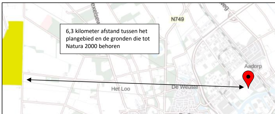
Ligging van Natura 2000-gebied in de omgeving van het plangebied. De ligging van het plangebied wordt met de rode marker aangeduid. Gronden die tot Natura 2000 behoren worden met de okergele kleur aangeduid (bron: pdok.nl).