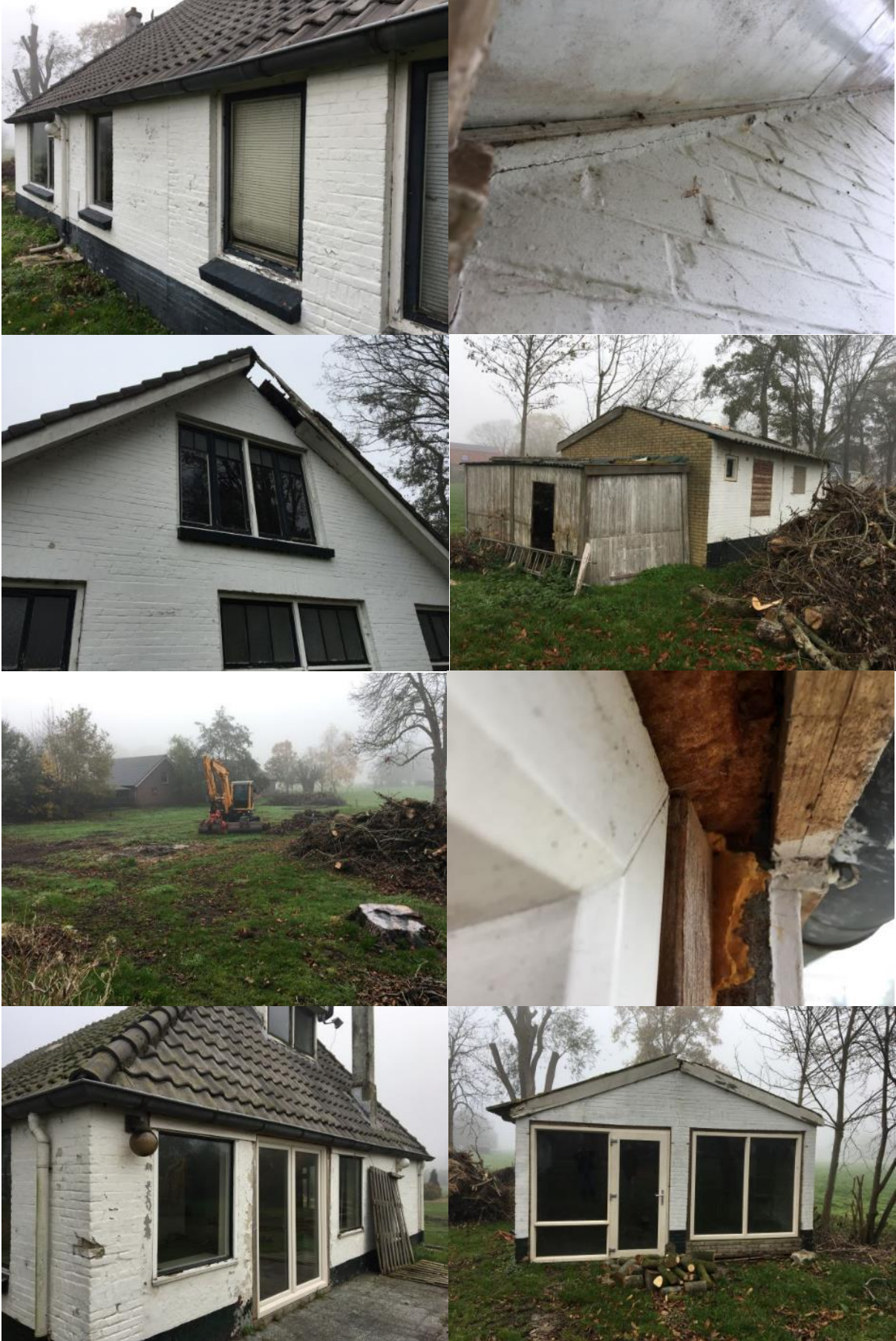
Bijlage 3. Fotobijlage. Impressie van het plangebied en de directe omgeving.