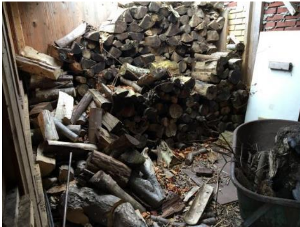
De houten aanbouw vormt een potentiële nestplaats voor sommige vogelsoorten.

nestelen niet in de woonkern Aadorp (NDFP 2020) en zijn gebonden aan grotere woonkernen en steden. In het plangebied zijn geen oude nesten van de huiswaluw of boerenzwaluw aangetroffen. Er nestelen geen vogels in de woning of de stenen schuur.