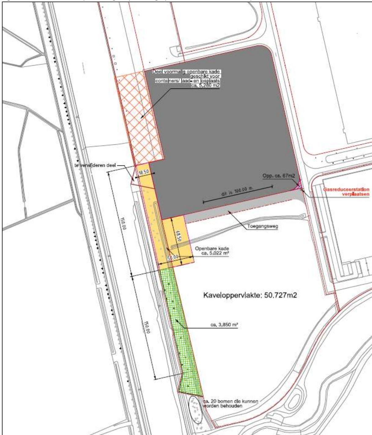
Figuur 1: ontwerptekening verplaatsing openbare kade XL Businesspark Twente

Dit nieuwe gebruik van de bestaande laad- en loskade is geen onderdeel van dit project, aangezien hiervoor geen ruimtelijke procedure noodzakelijk is. CTT Almelo zal de uitbreiding van haar activiteiten zelf regelen via een omgevingsvergunning milieu.