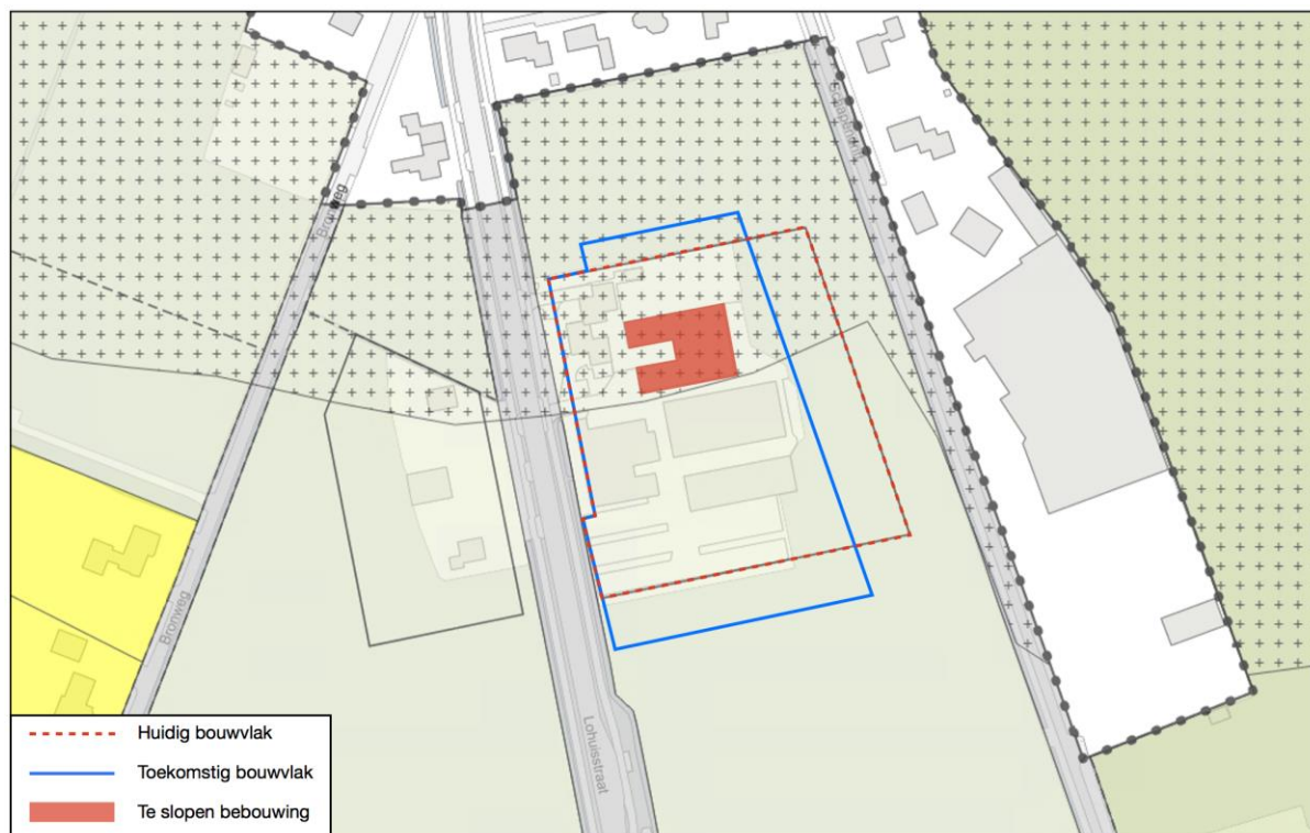
Afbeelding 2 Beoogde situatie Lohuisstraat 19