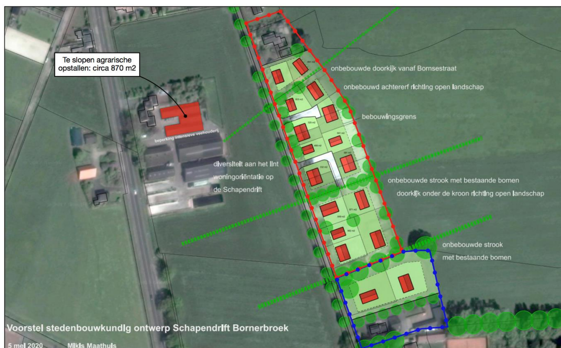
Afbeelding 1 Beoogde stedenbouwkundig ontwerp Schapendrift en sloopmeter Lohuisstraat 19

In afbeelding 1 en 2 is de beoogde situatie ter plaatse van het projectgebied weergegeven.