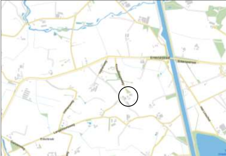
Globale ligging van het plangebied. De ligging van het plangebied wordt met de gele cirkel aangeduid.

Het plangebied is gesitueerd op en rond het adres Krooshoopsweg 3 te Bornerbroek. Het ligt in het buitengebied, 1,6 kilometer ten westen van de woonkern Bornerbroek. Op onderstaande afbeelding wordt de globale ligging van het plangebied weergegeven.