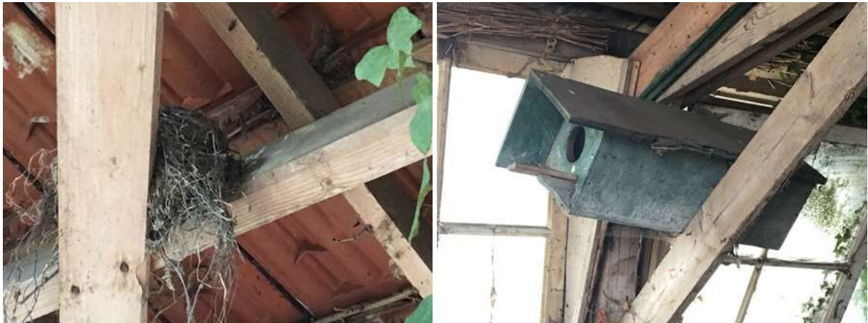
Foto links: oud merelnest in de wagenloods. Foto rechts: steenuilenkast in de wagenloods. Deze kast is niet in gebruik.

Het plangebied behoort tot functioneel leefgebied van verschillende vogelsoorten. Vogels benutten de buitenruimte als foerageergebied en vermoedelijk nestelen er ieder voortplantingsseizoen vogels in de bomen en struiken, in dichte vegetatie en in de te slopen wagenloods. Soorten die mogelijk in het plangebied nestelen zijn houtduif, holenduif, merel, winterkoning, roodborst, heggenmus, witte kwikstaart, koolmees en pimpelmees. In de te slopen wagenloods hangt een steenuilenkast welke gecontroleerd is tijdens het veldbezoek. Uit de controle is gebleken dat de kast niet gebruikt wordt als rust- of nestplaats door de steenuil. Tijdens het veldbezoek zijn in het plangebied geen huismussen waargenomen. Gelet op de inrichting, het gevoerde beheer en de bouwstijl van de wagenloods, wordt het plangebied als een ongeschikte nestplaats voor huismussen beschouwd. Geschikte nestplaatsen voor de huismus ontbreken in het plangebied. Er zijn in de wagenloods geen aanwijzingen gevonden dat bos- of kerkuil de loods benutten als nest- of rustplaats. Het agrarische perceel waarin de woning gebouwd wordt, vormt een ongeschikte nestplaats voor vogels.