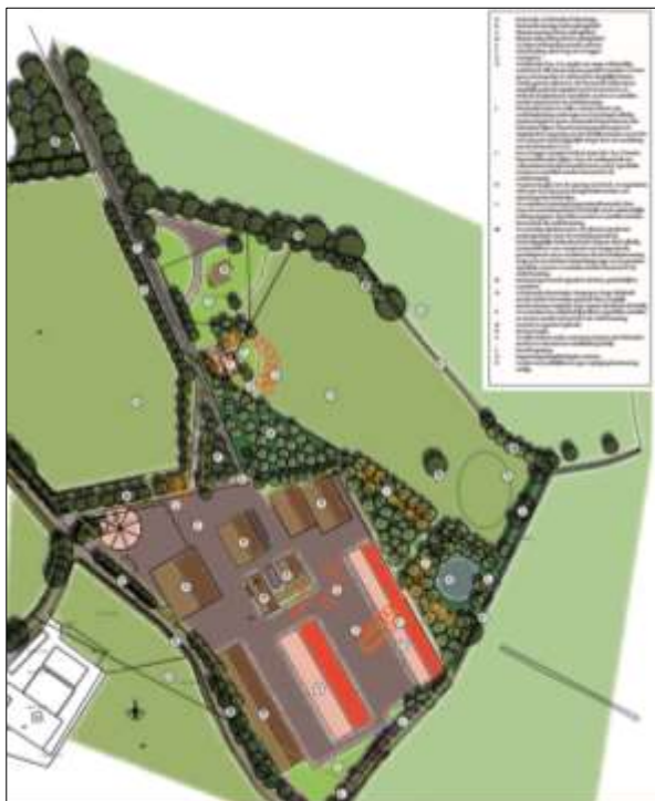
Verbeelding van het wenselijke eindbeeld van het plangebied na planrealisatie.

Het voornemen is om een nieuwe vrijstaande woning te bouwen, ten noorden van het erf waarop het loonbedrijf is gevestigd en twee nieuwe werktuigenbergingen te bouwen op het erf Krooshoopsweg 3. Om de bouw van de meest oostelijke werktuigenberging mogelijk te maken, dient een bestaande wagenloods gesloopt te worden, net als de bomen en struiken die langs de wagenloods staan. Het plangebied wordt landschappelijk ingepast door de aanleg van erfbeplanting. Voor een verbeelding van het wenselijke eindbeeld wordt verwezen naar onderstaande afbeelding.