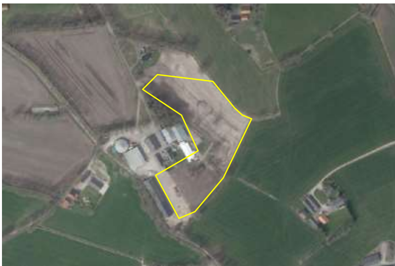
Detailopname van het plangebied. Het plangebied wordt met de gele lijn aangeduid.

Het plangebied bestaat deels uit een bedrijfslocatie van een loonbedrijf en bestaat deels uit agrarisch cultuurland. In het plangebied worden de volgende ecotopen aangetroffen: bebouwing, erfverharding, opgaande beplanting, open zand/braakland en agrarisch cultuurland. Het oostelijke deel van het plangebied bestaat uit agrarisch cultuurland; tijdens het veldbezoek in gebruik als akker (met groenbemester). Het zuidelijke deel bestaat grotendeels uit open zand/braakland. In het zuidelijke deel staat een oude wagenloods met bomen en struiken langs de zijkanten. Het betreft een houten loods welke gedekt is met dakpannen. De loods beschikt niet over dak- of wandisolatie en heeft geen beschoten kap. De loods was tijdens het veldbezoek in gebruik als berging. Op onderstaande afbeelding wordt het plangebied in detail weergegeven, evenals de begrenzing. Voor een verbeelding van het plangebied wordt naar de fotobijlage verwezen.