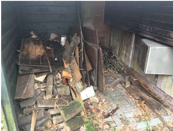
Houthok in het plangebied. In een houthok kunnen muizen en bruine rat prima een rust- en/of voortplantingslocatie bezetten.

Er zijn in het plangebied geen beschermde grondgebonden zoogdieren waargenomen, maar gelet op de inrichting en het gevoerde beheer, behoort het plangebied vermoedelijk tot functioneel leefgebied van verschillende algemene en weinig kritische grondgebonden zoogdiersoorten als mol, bruine rat, huismuis, huisspitsmuis, bosmuis, gewone bosspitsmuis, egel, steenmarter, bunzing, vos, konijn en haas. Voorgenoemde soorten benutten het plangebied hoofdzakelijk als foerageergebied, maar het is niet uitgesloten dat beschermde soorten als bosmuis, huisspitsmuis en gewone bosspitsmuis een rust- en/of voortplantingslocatie in het plangebied bezetten. Voorgenoemde soorten kunnen een rust- en/of voortplantingslocatie bezetten in gaten en holen in de grond, onder groen(afval), bladeren en opgeslagen goederen en in gebouwen (zoals het houthok). Er zijn geen aanwijzingen gevonden dat de steenmarter een rust- en/of voortplantingslocatie in het plangebied bezet.