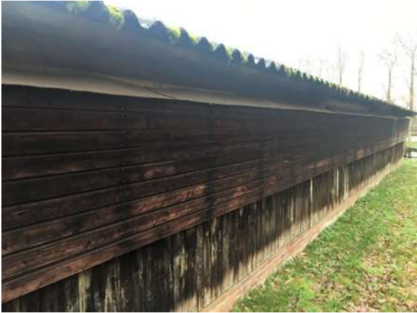
Ventilatiekanalen langs de zijkant van de schuren; deze wanden vormen een ongeschikte verblijfplaats voor vleermuizen.

Door uitvoering van de voorgenomen activiteiten worden geen vleermuizen verstoord, verwond of gedood en worden geen verblijfplaatsen beschadigd of vernield.