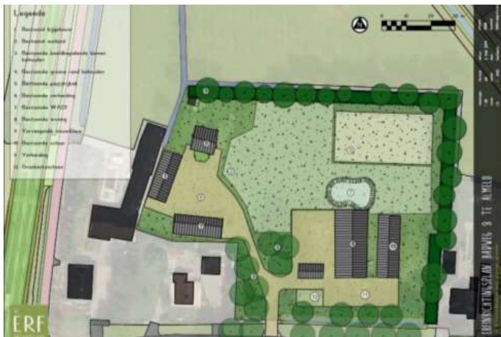
Verbeelding van het wenselijke eindbeeld.

Het concrete voornemen bestaat om de middelste schuur te slopen. Als vervangende nieuwbouw wordt een nieuwe schuur gebouwd op min of meer de locatie van de te slopen schuur. Tot de renovatiewerkzaamheden van de te behouden schuren behoren het vervangen van het dak en de wanden. Op onderstaande afbeelding wordt het wenselijke eindbeeld weergegeven.