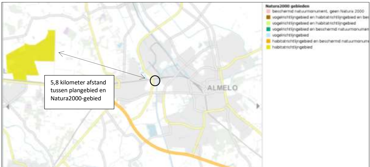
Ligging van Natura2000-gebied in de omgeving van het plangebied. De ligging van het plangebied wordt met de cirkel aangegeven. Gronden die tot Natura2000 behoren worden met de okergele kleur aangeduid.