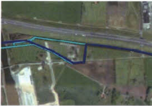
Figuur 1 Bestaande tracé

Hieronder is het bestaande en de gewenste tracé van de ondergrondse hogedruk aardgasleiding weergegeven.