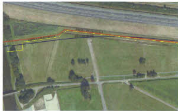
Figuur 2 Gewenste tracé