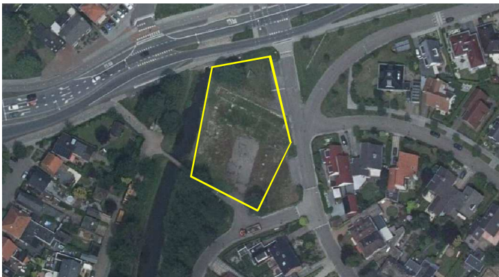
Detailweergave van het plangebied. De begrenzing wordt met de gele lijn aangeduid.

Het plangebied vormt een slooplocatie en bestaat uit verharding (erfverharding en betonvloeren) en braakland (o.a. met open zand en een pioniervegetatie). In het plangebied zijn de vloeren en fundering van het gebouw dat gesloopt is nog zichtbaar. Op onderstaande luchtfoto wordt het plangebied in detail weergegeven, evenals de begrenzing.