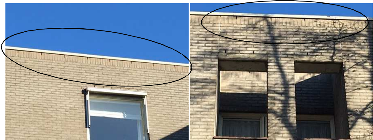
Open stootvoegen in de buitengevel. Deze worden met de ovaal aangeduid.

Er zijn in het plangebied geen holenbomen of andere potentiële verblijfplaatsen, zoals dakpannen, loodslabben, gevelbetimmeringen of vensterluiken waargenomen. Het is onbekend of vleermuizen daadwerkelijk een verblijfplaats in het gebouw bezetten, maar door het slopen van het gebouw gaan deze potentiële verblijfplaatsen verloren. Hierdoor worden mogelijk vleermuizen verwond en gedood.