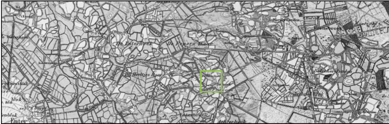
plangebied en omgeving rond 1900