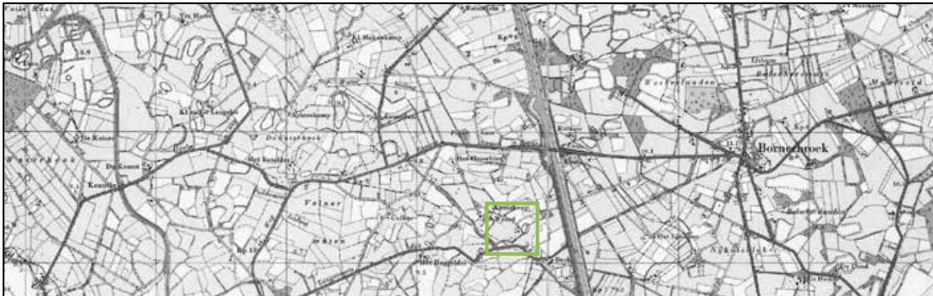
plangebied en omgeving rond 1950