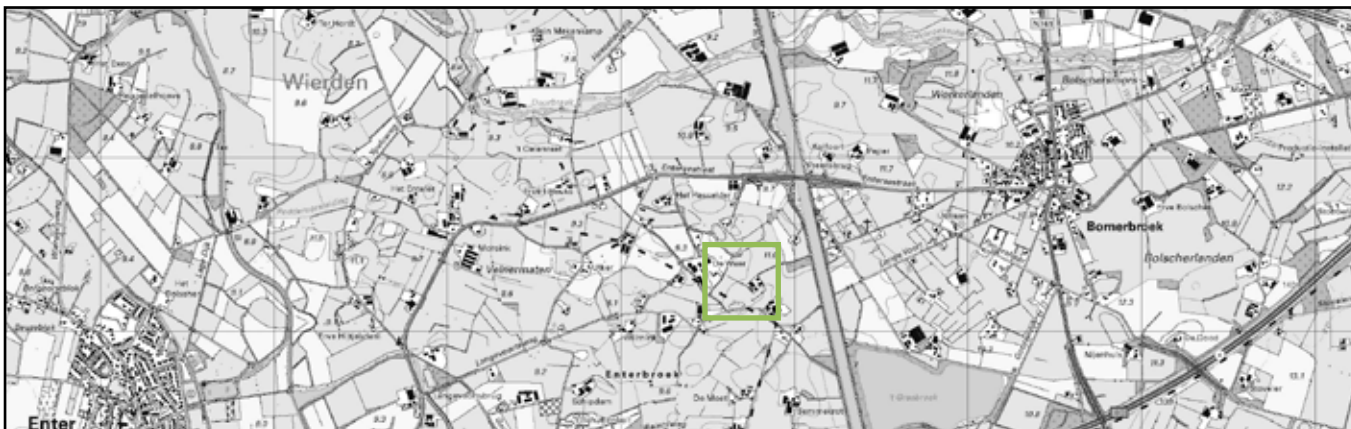
plangebied en omgeving rond 2010