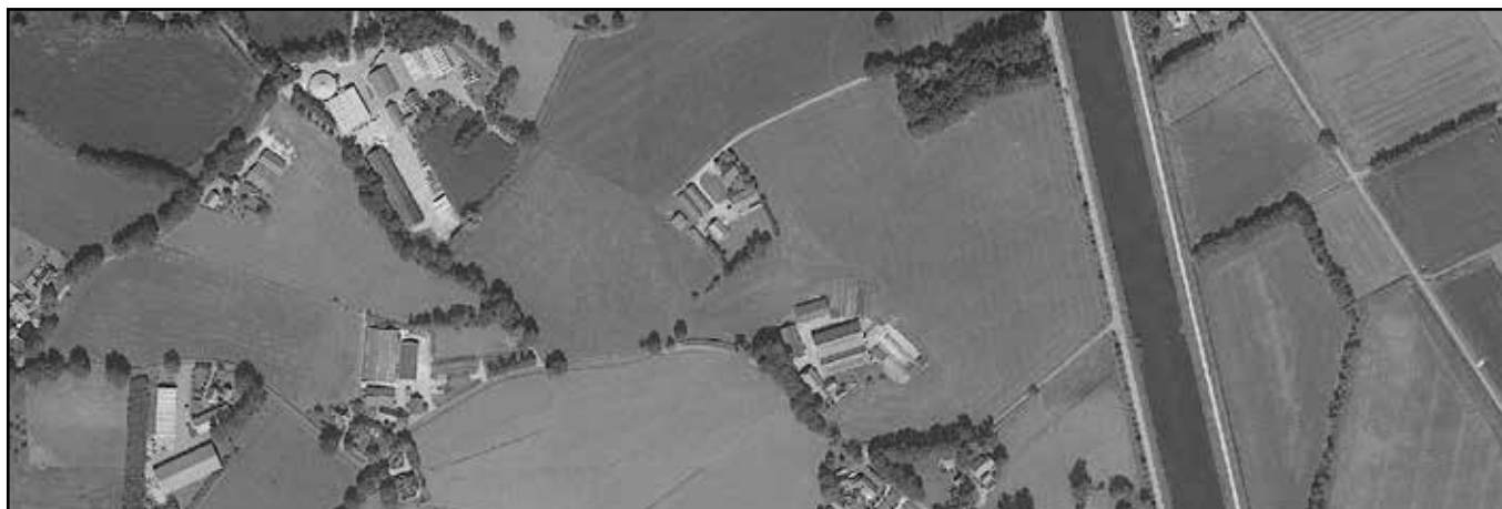
kampenlandschap- kleinschalige kamersrustructuur

Functies: Op een duurzame en efficiënte wijze ruimte scheppen voor de verschillende ruimte vragen de functies; het vergroten van de leefbaarheid van het platteland; het vergroten van de ruimtelijke kwaliteit.