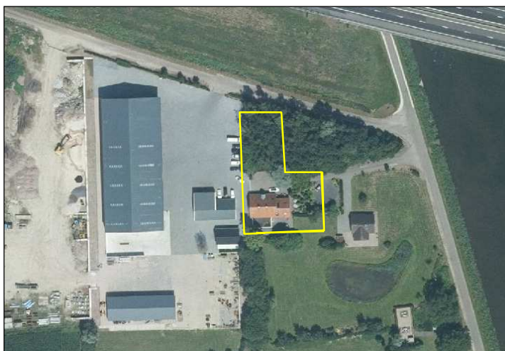
Detailweergave en begrenzing van het plangebied. De begrenzing van het plangebied wordt met de gele lijn.

Het plangebied vormt een deel van een bestaand grondverzetbedrijf en bestaat uit bebouwing, groen en opgaande beplanting. In in het plangebied staat een vrijstaande boerderij welke gebruikt wordt als kantoor. Het gebouw is gebouwd van bakstenen en beschikt over een holle spouw en is gedekt met gebakken dakpannen. Het voorhuis beschikt over een beschoten kap, het achterste deel niet. De boerderij heeft aan de voorzijde een houten topgevel op circa 30 cm afstand van de buitengevel. Het noordelijke deel van het plangebied bestaat uit een erfbosje met een vrij jonge begroeiing van berk, zomereik, veldesdoorn, hazelaar en lijsterbes. Aan de voorzijde van de boerderij ligt een eenvoudige siertuin met gazon, heesters en sierplanten. Op onderstaande afbeelding wordt het plangebied in detail weergegeven.