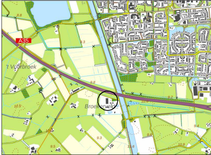
Globale ligging van het plangebied. De globale ligging wordt aangeduid met de cirkel.

Het plangebied is gesitueerd op het adres Breesegge 3 te Bornerbroek. Het ligt in het buitengebied, net ten zuiden van de stad Almelo. Op onderstaande afbeelding wordt de globale ligging van het plangebied aangeduid met de cirkel.