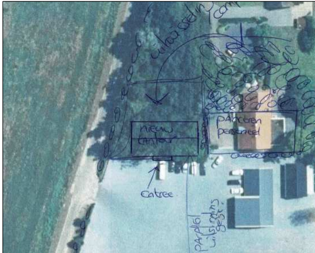
Verbeelding van het wenselijke eindbeeld.

Het voornemen bestaat om de bestaande bebouwing te slopen en een nieuw kantoorgebouw op te richten. Om de bouw mogelijk te maken wordt een deel van het bestaande erfbosje geroid. Minimaal de gelijke oppervlakte aan beplanting wordt binnen het plangebied weer herplant. Op onderstaande afbeelding wordt het initiatief in schetsvorm weergegeven.