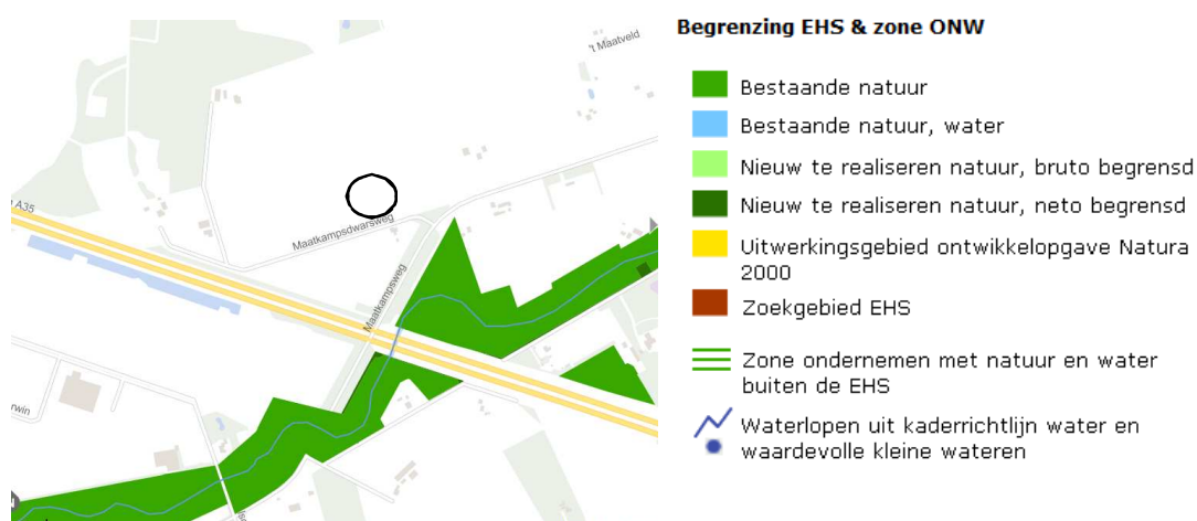
Ligging van de EHS en waardevolle wateren nabij het plangebied. Het plangebied wordt met de rode contour aangeduid.

Het plangebied ligt niet in of directe naast gronden die tot de EHS of waardevolle watergang behoren. Op onderstaande kaart wordt de ligging van de EHS nabij het plangebied weergegeven.