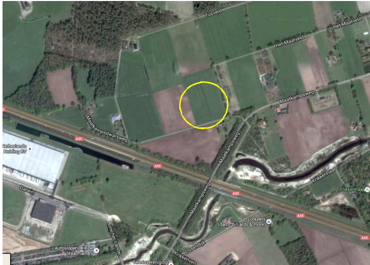
Globale ligging van het plangebied in de omgeving. Het plangebied wordt met de cirkel aangeduid.

Het plangebied is gesitueerd op het adres Maatkampdwarsweg (ongenummerd) in Bornerbroek. Het ligt in het buitengebied, circa 2 kilometer ten zuidoosten van de stad Almelo. Op onderstaande afbeelding wordt de globale ligging van het plangebied weergegeven met de cirkel.