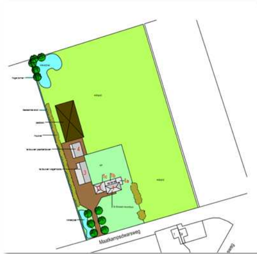
Wenselijke nieuwe situatie.

Op onderstaande afbeelding wordt een verbeelding van het nieuwe erf weergegeven.