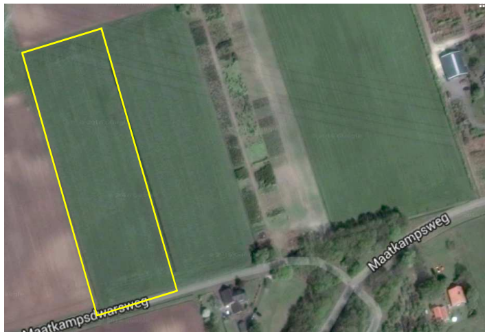
Detailopname van het plangebied. Het plangebied wordt met de lijn aangeduid.

Het plangebied bestaat uit volledig agrarisch cultuurland, tijdens het veldbezoek in gebruik als grasland. Het plangebied grenst aan de west-, noord- en oostzijde aan agrarisch cultuurland en aan de zuidzijde aan de Maatkampdwarsweg. Open water, bebouwing en opgaande beplanting ontbreken. Het plangebied kent een agrarisch gebruik. Het wordt intensief, met bijbehorende mestgift beheerd.