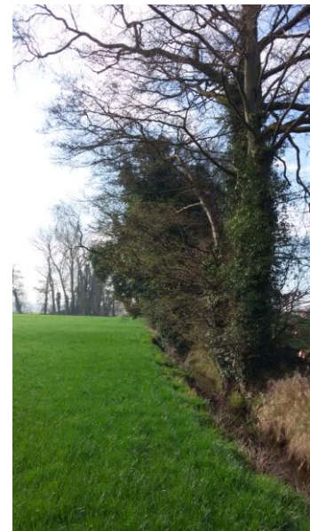
Figuur 2. 1: Oude singel in plangebied

De kruidlaag van de singels en houtwallen is goed ontwikkeld met soorten van oude beplantingen op voedselarme bodem als Klimop, Wilde kamperfoelie en Bosanemoon. Dit duidt op oude bosgroeiplaatsen.