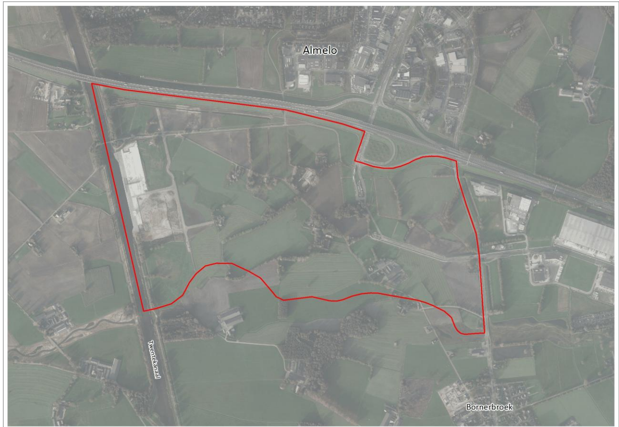
Figuur 1.1 Globale ligging van het plangebied (rood omlijnd).