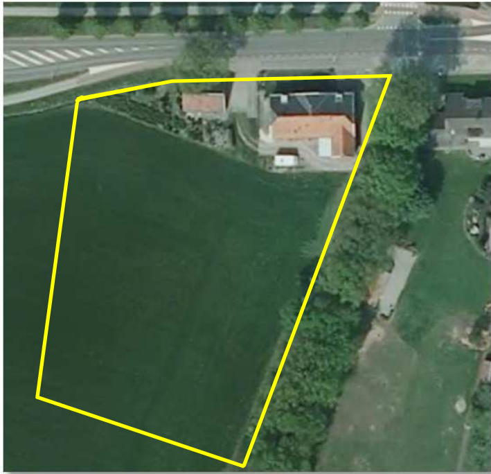
Detailopname van het onderzoeksgebied.