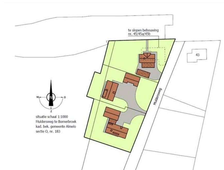
Weergave van de wenselijke nieuwe situatie.

Er zijn concrete plannen om alle bebouwing op het perceel te slopen en een nieuwe woningen op het erf te bouwen. Ten zuiden van het huidige erf worden twee nieuwe woningen met bijgebouw opgericht. Alle drie de woningen worden ontsloten via de Muldersweg. Op onderstaande afbeelding wordt de nieuwe wenselijke situatie weergegeven.