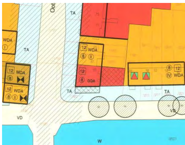
Figuur 2 Uitsnede geldend bestemmingsplan