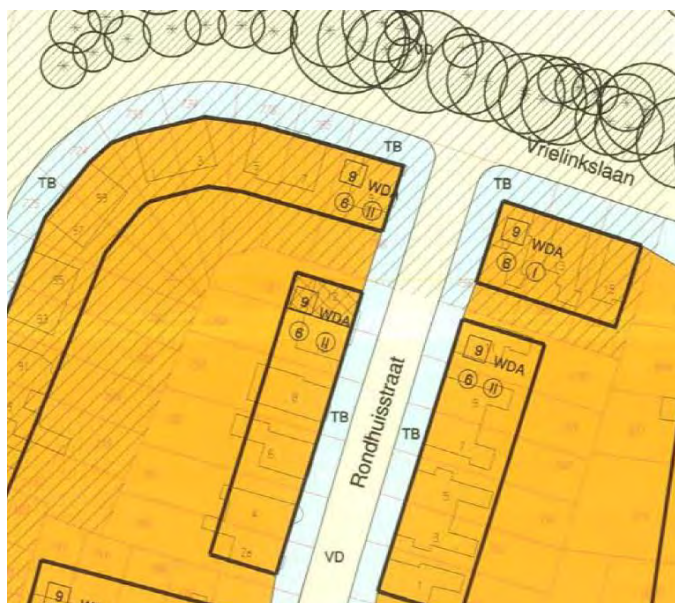
Figuur 4 Geldend bestemmingsplan

In het geldende bestemmingsplan 'Haghoek Rosarium' is het perceel Rondhuisstraat 12 bestemd als Wonen, maar hier is vervolgens door GS goedkeuring onthouden. Hierdoor dient te worden teruggevallen op het voorgaande bestemmingsplan uit 1950. Doordat deze dateert vóór 1965 is deze bij recht komen te vervallen. Feitelijk geldt voor dit perceel dan ook geen planologisch regime. Uitgangspunt is dan de verleende bouwvergunning en andere vergunningen en inschrijving in de Gemeentelijke Basisadministratie (GBA) en de Kamer van Koophandel (KvK). Hieruit blijkt dat appellant zelf woonachtig is op het perceel en dat kantoor wordt gehuisvest op dit adres.