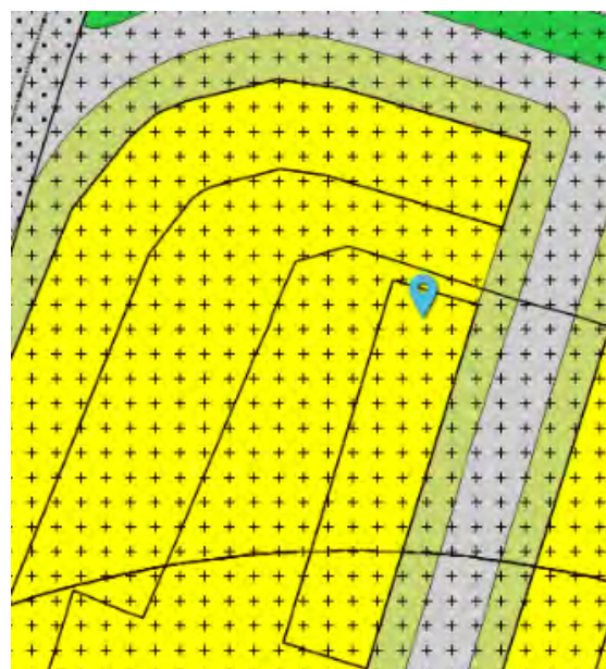
Figuur 5 Ontwerpbestemmingsplan

Aangezien de hoofdactiviteit en uitstraling van het pand aan de Rondhuisstraat 12 wonen is, is deze conform bestemd. Binnen de bestemming Wonen is een aan huis verbonden beroeps- of bedrijfsactiviteit toegestaan. Aangezien het huidige gebruik als kantoor niet overeenkomt met de aan huis-verbonden beroeps- of bedrijfsactiviteiten, zoals de maximale norm van 50m 2 wordt in het onderhavige bestemmingsplan de functie-aanduiding 'kantoor' opgenomen voor het perceel Rondhuisstraat 12. Hierdoor is eveneens een kantoor mogelijk. Dit komt overeen met de feitelijke situatie van appellant. Het vast te stellen bestemmingsplan wordt op dit punt gewijzigd.