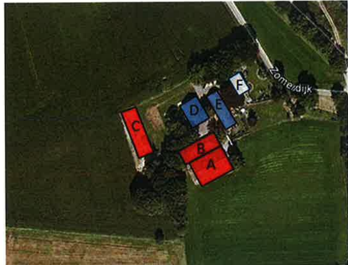
Figuur 3: aanwezige bebouwing