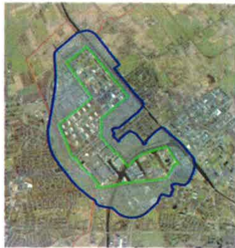
Afbeelding 1: Begrenzing oude (linker afbeelding) en nieuwe verkleinde geluidzone