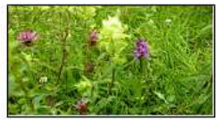
Kruidenrijk grasland / halfnatuurlijk grasland