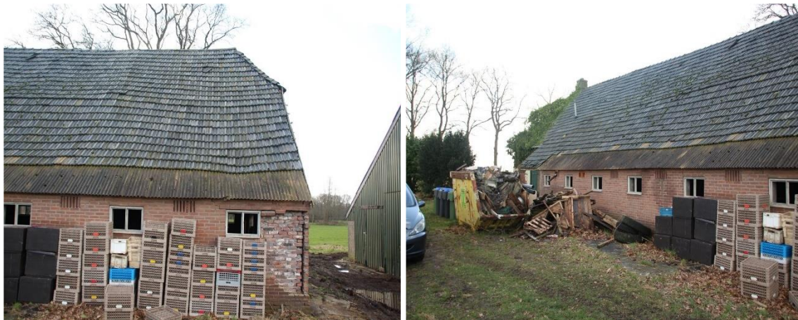
Amfibieën kunnen een (winter)rustplaats bezetten onder verspreide spullen/materialen in de buitenruimte.

Door het uitvoeren van grondverzet, het verwijderen van strooisel en bladeren en het verwijderen van verspreide spullen/materialen wordt mogelijk een amfibie gedood en wordt mogelijk een vaste (winter)rustplaats beschadigd en/of vernield. Als gevolg van de voorgenomen activiteiten neemt de geschiktheid van het plangebied als foerageergebied van amfibieën niet af.