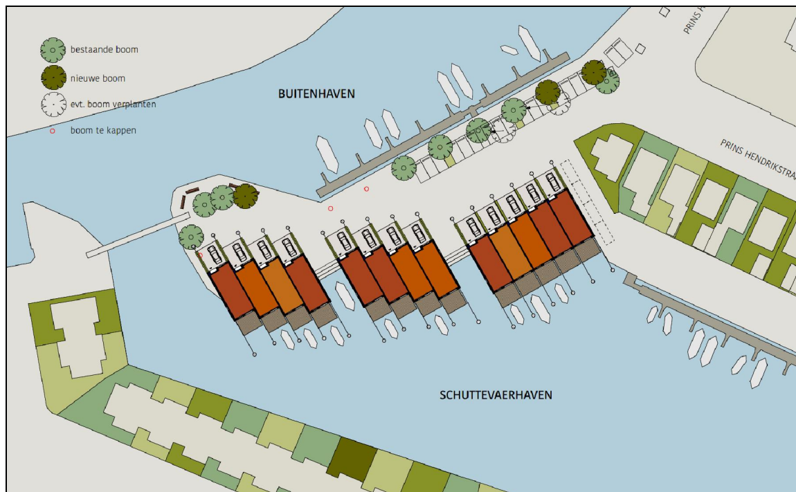
Figuur 4. Situering van het plan aan de Prins Hendrikkade te Meppel.