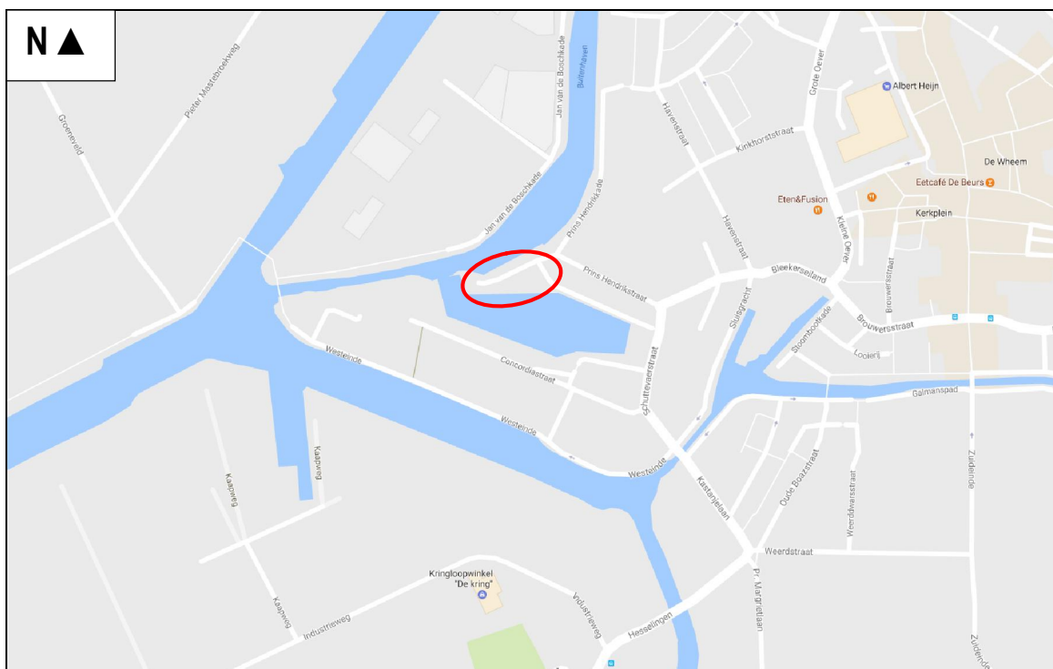
Figuur 1. Globale ligging van het plangebied te Meppel.

Het plangebied is gelegen op de punt van de Prins Hendrikkade te Meppel. Dit gebied bestaat uit een braakliggend gebied. In figuur 2 wordt een beeld gegeven van het plangebied op dinsdag 20 juni 2017. Het plan is om woonbebouwing te realiseren die aansluiten op de reeds aanwezige aanlegplaatsen van de Schuttevaerhaven. In figuur 3 wordt een beeld gegeven van de plannen.