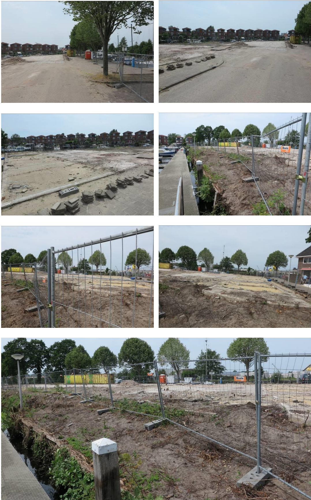
Figuur 2. Foto-impressie van het plangebied aan de Prins Hendrikkade te Meppel.