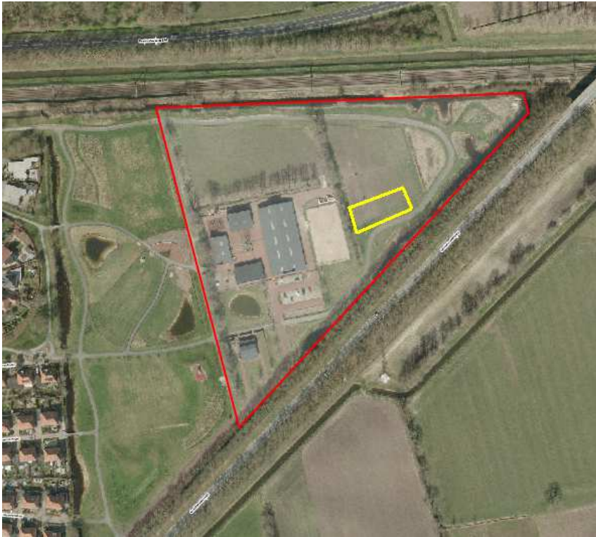
Figuur 1: De ligging van het de manege, rood omlijnd. De locatie voor de jeu-de-boulesbanen is geel omlijnd.

Het plangebied ligt aan Oosterboerweg 35b te Meppel in de provincie Drenthe. In figuur 1 is de ligging van het plangebied weergegeven.