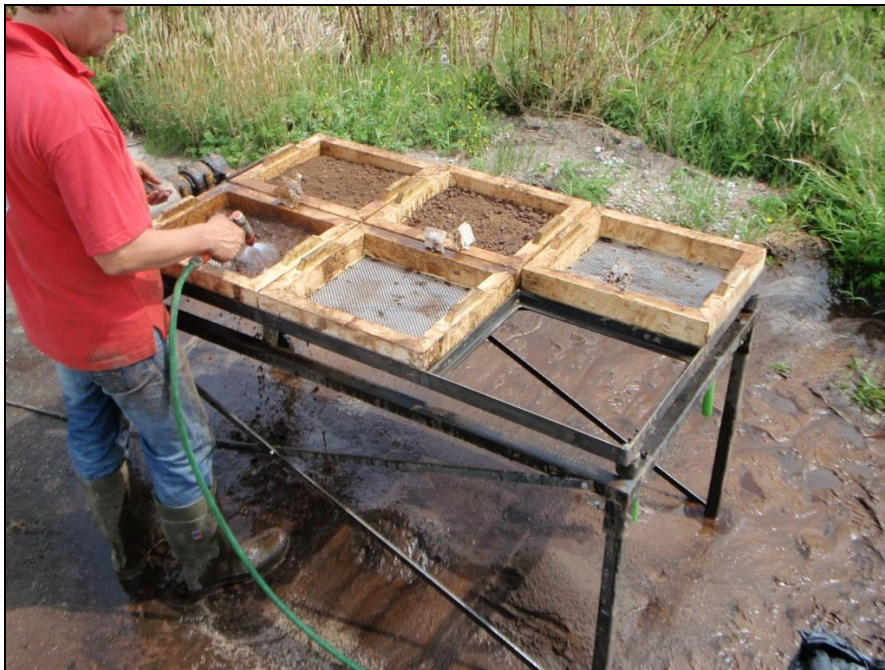
Afbeelding 3. Het zeven van de monsters