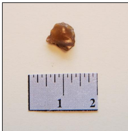
Afbeelding 4. Vuurstenen kling/afslag, fragment uit boring 413 (schaal in cm)

De vuursteenvondst betreft een fragment van een kling/afslag. Er is een duidelijke slagbult zichtbaar (zie afbeelding 4) en er zijn slaggolven te zien. De kling is niet compleet; daardoor kan niet uitgesloten worden dat het om een afslag gaat. Bij een kling zou duidelijk sprake moeten zijn van een lengte die groter is dan de breedte, terwijl bij een afslag lengte en breedte min of meer gelijk zijn. De kling/afslag kan bij de bewerking van vuursteen zijn ontstaan.