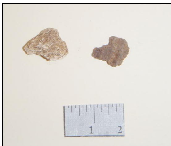
Afbeelding 7. Verbrand bot van boring 283 (links) en boring 248 (rechts)