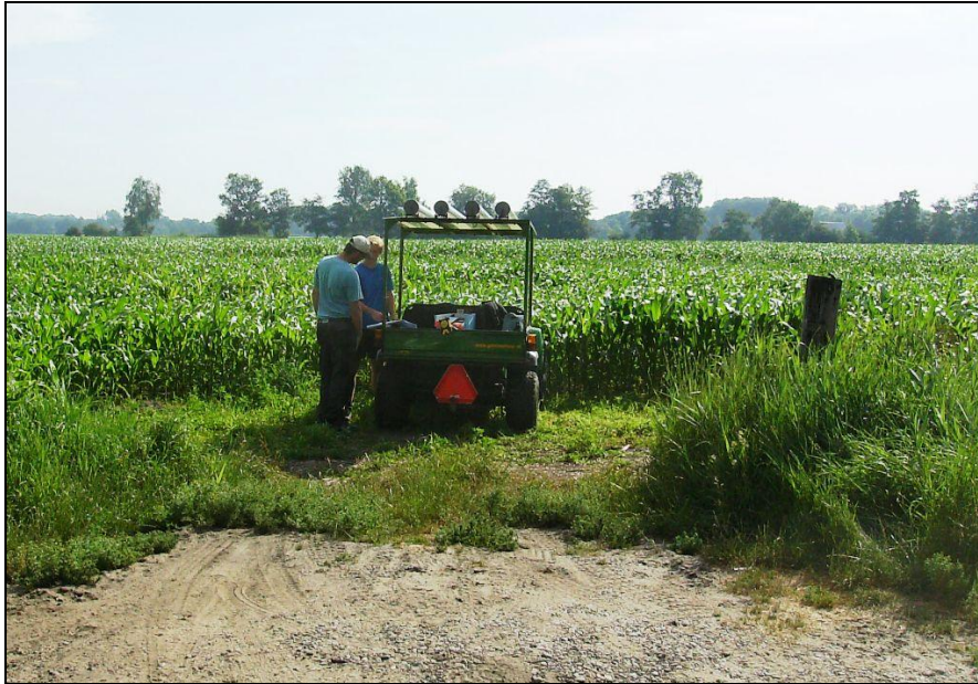
Afbeelding 2. De inzet van de gator om de monsters uit het veld te krijgen

De grondmonsters zijn in de werkplaats van Koninklijke Sjouke Dijkstra te Aduard gezeefd met behulp van water op een zeefinstallatie van MUG Ingenieursbureau (zie afbeelding 3). Op deze zeefinstallatie worden de monsters gezeefd over een zeef met een maaswijdte van 4 mm. Na droging zijn de zeefresiduen gewaardeerd op het voorkomen van archeologische indicatoren.