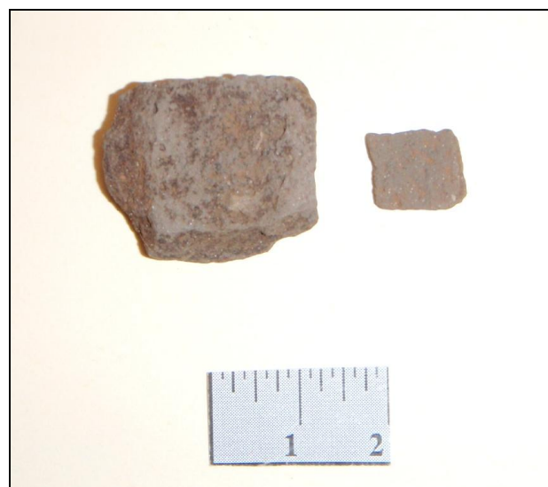
Afbeelding 6. Grijsbakkend aardewerk uit boring 232