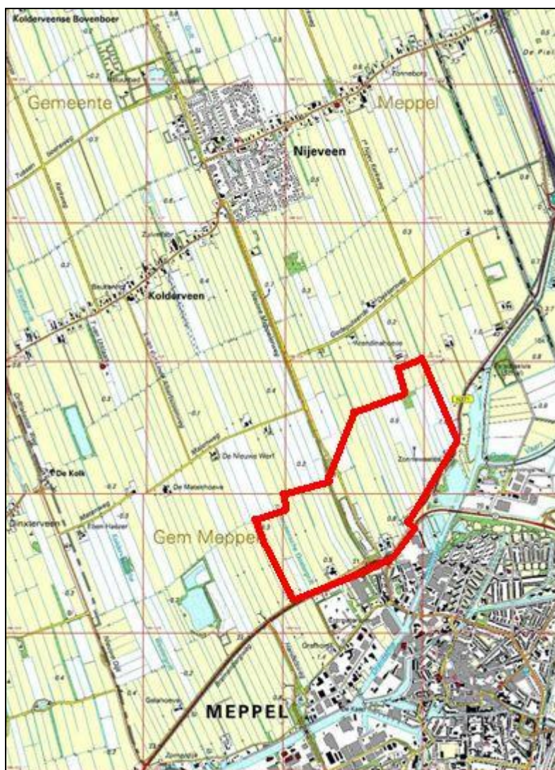
Abbeelding 1. Topografische kaart waarop het onderzoeksgebied met een rood contour is aangegeven