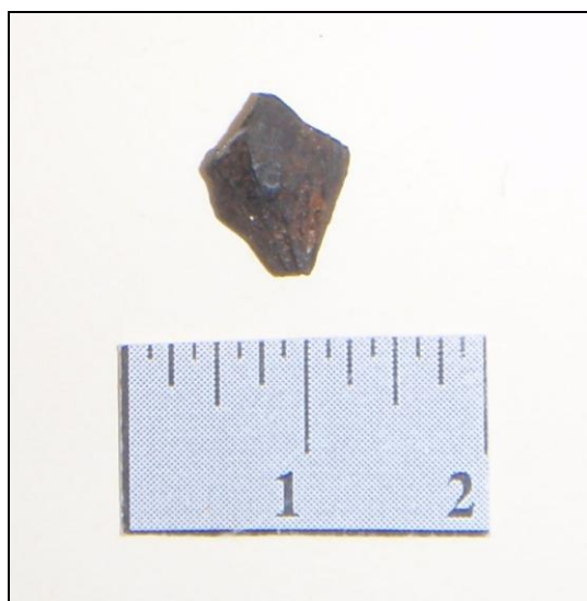
Afbeelding 5. Verkoold schub van een dennenappel

In boring 232 zijn twee fragmenten grijsbakkend aardewerk met zandmagering aangetroffen (zie afbeelding 6). In het grootste fragment is ook houtskool meegebakken. Dit aardewerk is ouder dan het roodbakkende aardewerk. In deze boring gaat het om een vrij groot fragment dat vermoedelijk dateert uit de 12 e eeuw. In boring 186 is een klein fragment grijsbakkend aardewerk aanwezig. In twee van de drie boringen waarin bot is aangetroffen, betreft het verbrand botmateriaal (boring 248 en 283, zie afbeelding 7).