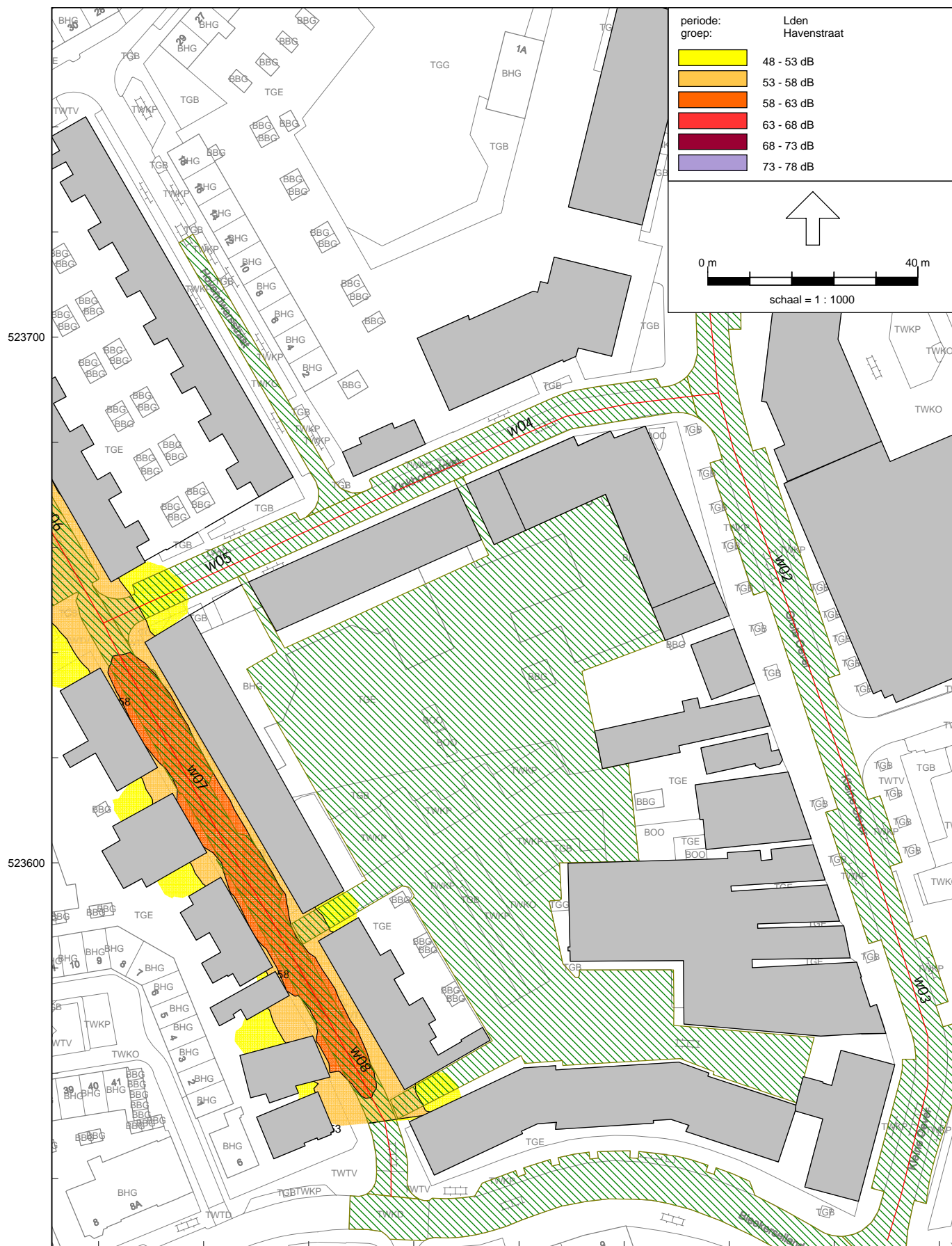
Overzicht van de berekende Lden geluidscontouren vanwege de Havenstraat (excl. aftrek o.g.v. art. 110g Wgh)