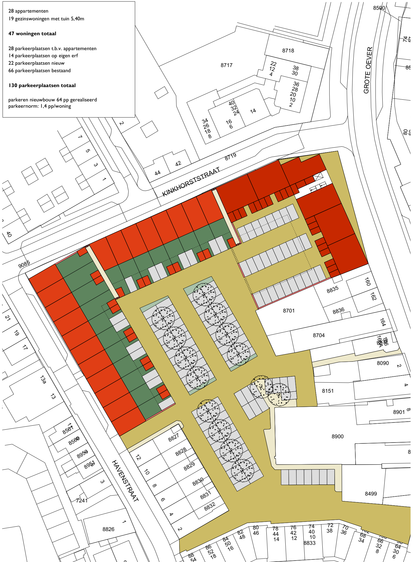
Figuur 1: Overzicht van het plangebied

parkeren nieuwbouw 64 pp gerealiseerd parkeernorm: 1,4 pp/woning