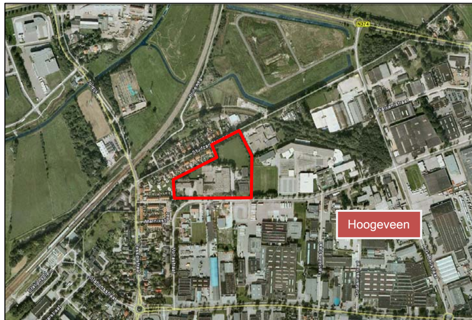
Figuur 1: Ligging van het plangebied (rood omljnd) binnen de bebouwde kom van Hoogeveen.

De beoogde plannen op de locatie voorzien in de sloop van de aanwezige bebouwing en het (lokaal) verwijderen van beplanting.