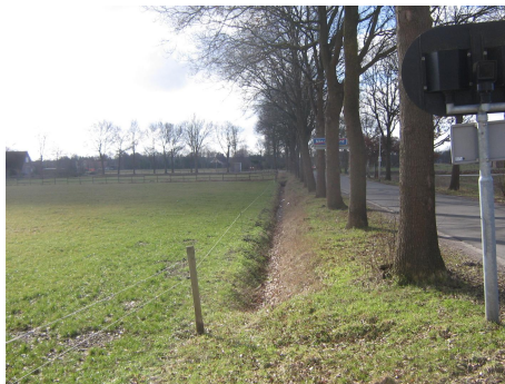
Foto 2 Bomenrij aan de westzijde van het projectgebied