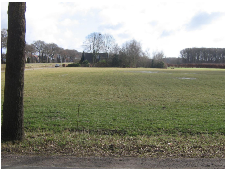
Foto 1 voorzijde projectgebied

Onderstaande foto's geven een impressie van de projectlocatie en de omgeving.