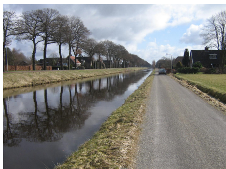
Foto 3 De Hoogeveense vaart aan de noordzijde van het projectgebied