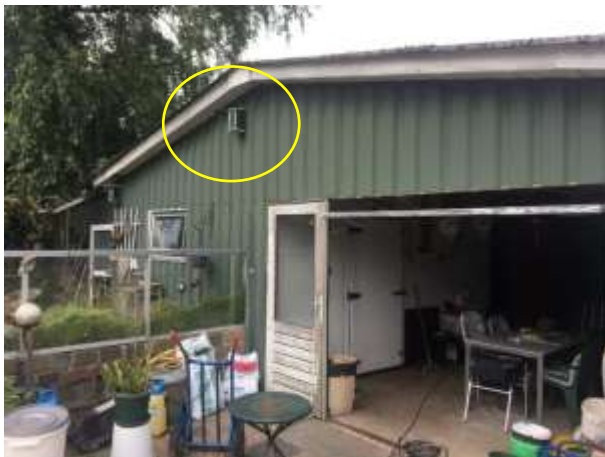
Deze nestkasten kunnen als nestlocatie dienen voor koolmees en pimpelmees

Het plangebied behoort tot functioneel leefgebied van verschillende vogelsoorten. Vogels benutten het plangebied als foerageergebied en vermoedelijk nestelen er jaarlijks vogels in het plangebied. Vogels kunnen nestelen in de toegankelijke bebouwing, nestkasten en de beplanting. Vogelsoorten die mogelijk in het plangebied nestelen zijn merel, houtduif, vink, tjiftjaf, koolmees en pimpelmees. De kapschuur, de schuur die volledig bedekt is met houtbetimmering en de schuur die volledig bedekt is met damwanden betimmering, beschikken over invliegopeningen en kunnen daardoor dienen als potentiële nestlocatie voor verschillende vogelsoorten. De andere schuur is goed afgesloten en is daardoor niet geschikt voor vogels om een nestplaats in te bezetten. De restanten van de gesloopte schuur dient niet als potentiële nestplaats voor vogels. De nestkasten zijn geplaatst tegen een van de buitengevels van de damwanden betimmerde schuur. In het plangebied zijn geen potentiële nestlocaties voor huismussen aanwezig. Tevens zijn er geen aanwijzingen gevonden dat steen- of kerkuil een vaste rust- of voortplantingsplaats bezetten. Er zijn ook geen aanwijzingen gevonden dat roofvogels een vaste rust- of voortplantingsplaats bezetten in het plangebied.