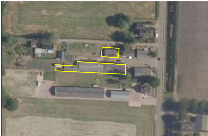
Begrenzing van het plangebied; deze wordt met de gele lijnen aangeduid.

Dit deelgebied vormt een deel van een agrarisch erf en bestaat uit bebouwing, erfverharding, beplanting, opgeslagen spullen, rommel en puin. De bebouwing bestaat uit vier schuren en een kapschuur. De meest oostelijk gelegen schuur beschikt over bakstenen buitengevels met luchtpouw waarvan de buitengevels volledig gedekt zijn met damwanden. Naast deze schuur staat een schuur die beschikt over bakstenen buitengevels met luchtpouw. De andere schuur beschikt over enkelsteens buitengevels die volledig betimmerd zijn met hout. De kapschuur beschikt over houten buitenwanden. De drie schuren beschikken over een golfplaten gedekt zadeldak en de kapschuur beschikt ook over een golfplaten gedekt dak. De beplanting bestaat uit Hedera begroeiing tegen de buitengevel van de houtbetimmerde schuur. De rommel en puin bestaat uit houten planken, plastic, oud ijzer en ligt verspreid in de bebouwing en in de buitenruimte van het plangebied. Tevens liggen er restanten van een oude schuur in het plangebied. Ten oosten van het plangebied ligt de Marten Kuilerweg.