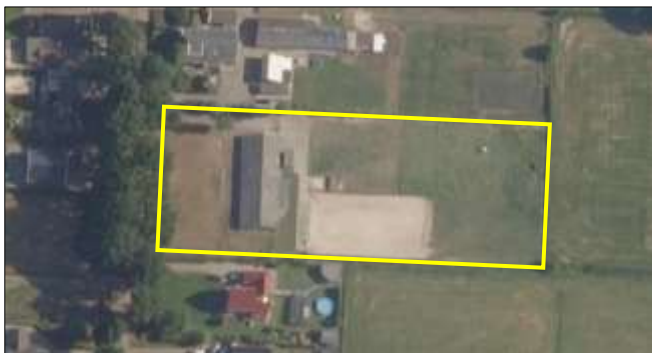
Begrenzing van het plangebied; deze wordt met de gele lijnen aangeduid.

Het bestaat uit bebouwing, beplanting, grasland en erfverharding. De bebouwing vormt een agrarisch bedrijfsgebouw met bijgebouw. Het bedrijfsgebouw beschikt over enkelsteense buitengevels die deels betimmerd zijn met damwanden en over een golfplaten gedekt zadeldak. Het bijgebouw vormt een overkapping bestaande uit damwanden buitengevels en staat ten oosten van het bedrijfsgebouw. De beplanting bestaat uit twee coniferen die tegen de noordelijke zijde van het bedrijfsgebouw staan. Het grasland ligt in het zuidelijke en westelijke deel van het plangebied en vormt een weiland dat met gaas is omheind. Ten westen van het plangebied staan enkele solitaire loofbomen en ligt de Dorpsstraat. Op onderstaande luchtfoto is de begrenzing van het plangebied aangegeven. Voor een impressie van het plangebied wordt verwezen naar de fotobijlage.