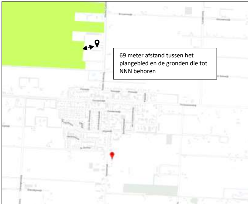
Ligging van Natuurnetwerk Nederland in de omgeving van beide deelgebieden. Deelgebied Marten Kuilerweg wordt met de zwarte marker aangeduid, deelgebied Dorpsstraat wordt met de rode marker aangeduid. Gronden die tot Natuurnetwerk Nederland behoren worden met de lichtgroene kleur op de kaart aangeduid.