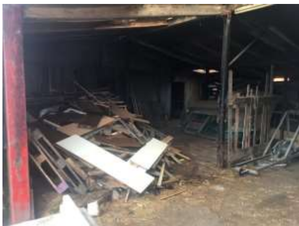
Amfibieën kunnen een (winter)rustplaats bezetten onder rommel en afval.

Tijdens het veldbezoek zijn geen amfibieën waargenomen, maar gelet op de inrichting en het gevoerde beheer, wordt het plangebied als functioneel leefgebied voor sommige algemene en weinig kritische amfibieënsoorten beschouwd. Amfibieën als bruine kikker en gewone pad benutten het plangebied als foerageergebied en mogelijk bezetten ze er een (winter)rustplaats. Deze soorten kunnen een (winter)rustplaats bezetten onder opgeslagen spullen, rommel en puin zowel in de toegankelijke gebouwen als in de buitenruimte. De toegankelijke bebouwing zijn de hout betimmerde schuur, de damwanden betimmerde schuur en de kapschuur. Het plangebied wordt niet als functioneel leefgebied van zeldzame amfibieënsoorten als kamsalamander, rugstreppad of poelkikker beschouwd. Geschikt voortplantingsbiotoop ontbreekt in het plangebied.