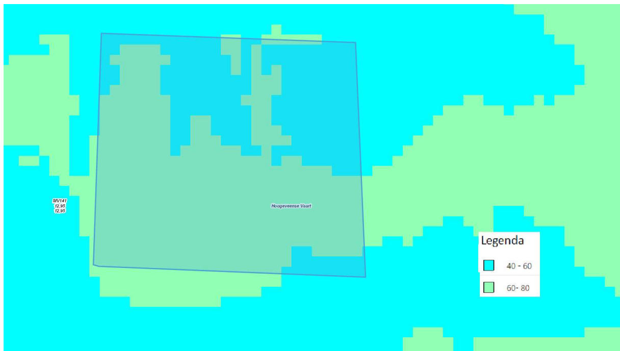
Figuur 2 Kaartbeeld bestaande grondwaterstand in cm rond het plangebied