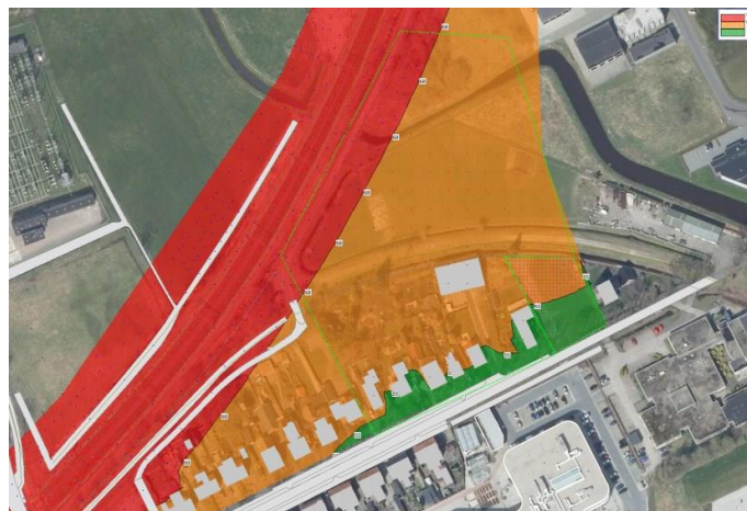
Afbeelding 2 Contouren Railverkeerslawaaï

Zoals blijkt uit afbeelding 2 is het mogelijk binnen het zuidelijke deel van het plangebied, tot ongeveer 25 meter uit de rand van de Stuifzandseweg woningbouw te realiseren in het kader van spoorweglawaaï.