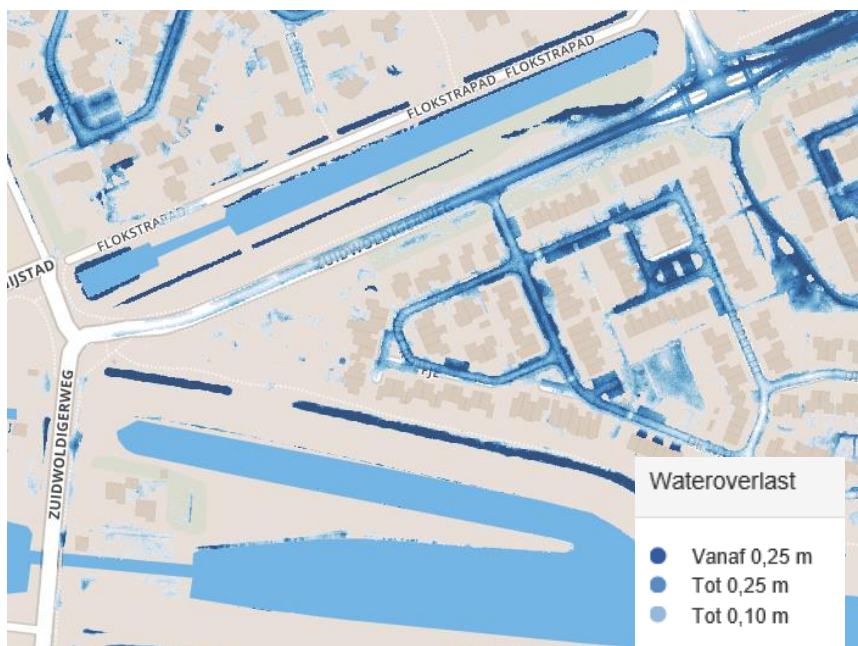
Figuur 2 Kaartbeeld wateroverlast bij zeer extreme situatie (60mm/uur)