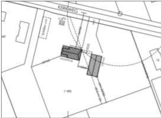
Verbeelding van het wenselijke eindbeeld.

Het voornemen is om een woning met garage te bouwen in het plangebied. Om de bouw mogelijk te maken, dient het plangebied bouwrijp gemaakt te worden. Op onderstaande afbeelding wordt het wenselijke eindbeeld, na planrealisatie, weergegeven.