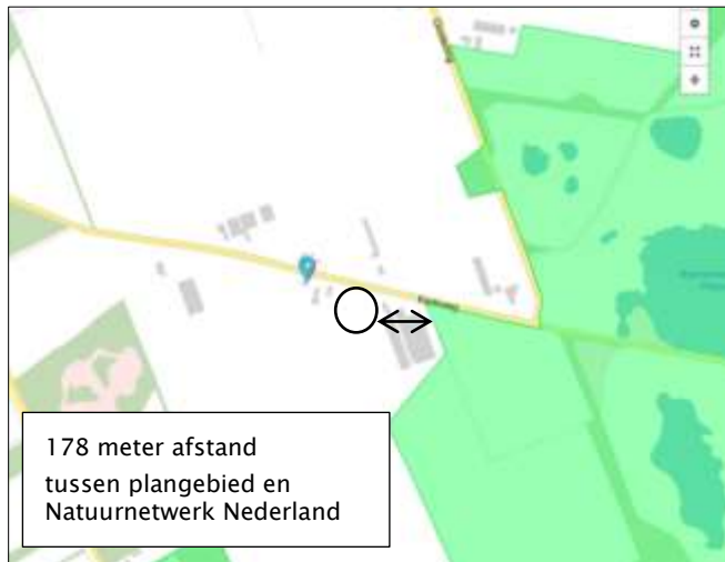
Ligging van Natuurnetwerk Nederland in de omgeving van het plangebied.

Het plangebied behoort niet tot het Natuurnetwerk Nederland of tot Natura2000. Het ligt op minimaal 178 meter afstand van gronden die tot het Natuurnetwerk Nederland behoren en ligt op minimaal 3,5 kilometer afstand van gronden die tot Natura2000 behoren.