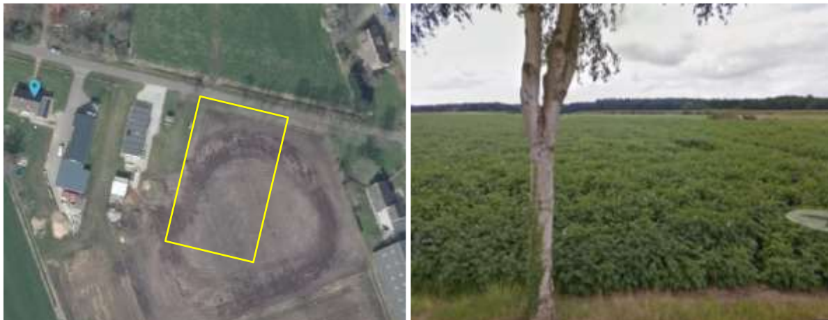
Links: luchtfoto van het plangebied, inclusief begrenzing. Rechts: aanzicht op het plangebied (google streetview 2019).

Het plangebied is gesitueerd aan de Kerkweg, ongenummerd, te Pesse. Het ligt in het buitengebied, iets ten oosten van het erf Kerkweg 8 te Pesse. Het plangebied bestaat volledig uit agrarische cultuurgrond, doorgaans in gebruik als akker. Opgaande beplanting, zoals bomen en struiken en bebouwing ontbreken in het plangebied. Op onderstaande afbeelding wordt de begrenzing van het plangebied weergegeven.