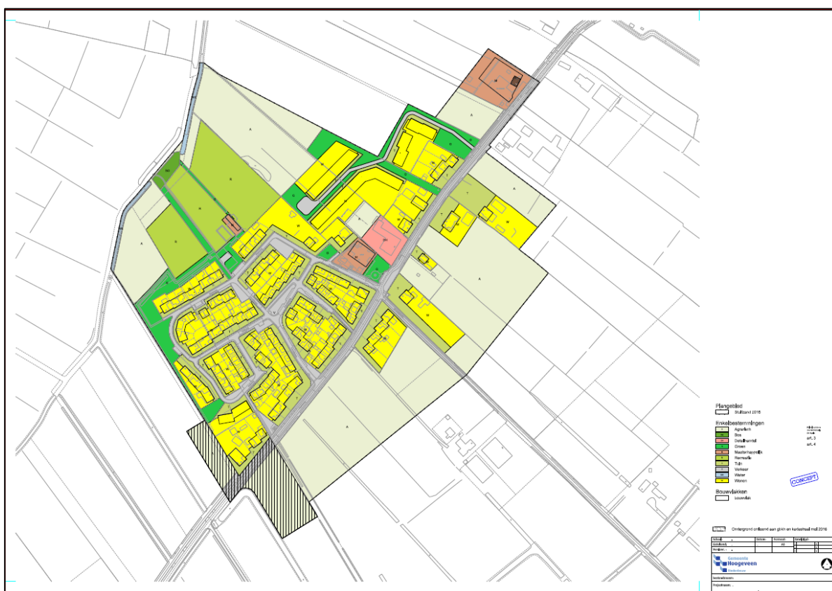
Figuur 1 Plangebied Bestemmingsplan Stuifzand

Het plangebied is in de afbeelding hieronder weergegeven.