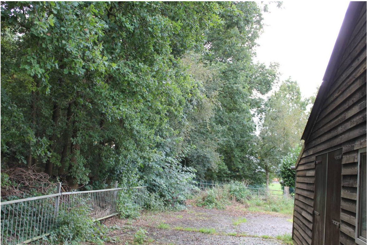
AANGRENZEND BOSPERCEEL ZUIDZIJDE