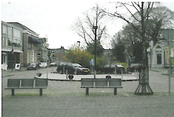
Figuur 11. Hoogeveen, Locatie Hoofdstraat Noord: foto genomen vanaf het zuiden naar het noorden toe.

Deze locatie ligt ten noorden van het deel van de Hoofdstraat dat voetgangersgebied is (zie Figuur 11). Het circa 0,6 hectare grote terrein bestaat uit een langgerekte groenstrook in het midden met aan weerszijden straat en parkeerplaatsen. De noordelijke begrenzing wordt gevormd door de Blankenslaan Oost die ten westen van de Hoofdstraat overgaat in de Willemskade.