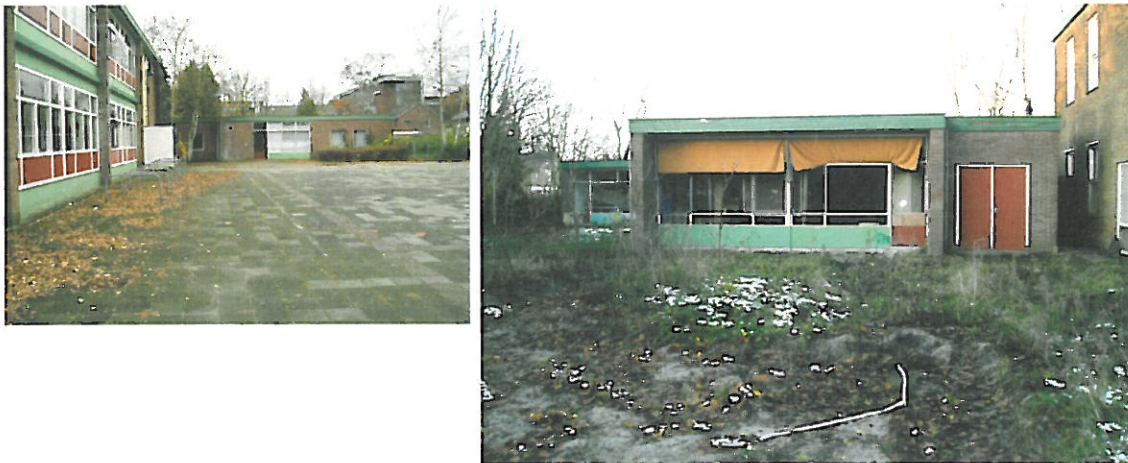
Figuur 10. Hoogeveen, Locatie 8 Reviusplein: foto's van de locatie. De linkerfoto is genomen vanaf het noordoosten in westelijke richting. De rechterfoto is vanaf het zuidwesten in noordelijke richting genomen.

Ten noorden van de Schutstraat en Locatie 7 Schutstraat bevindt zich de achtste locatie, Reviusplein (zie Figuur 10). Dit circa 0,25 hectare grote terrein is grotendeels bebouwd met een school. Ten oosten, zuiden, westen en noordwesten is gras aanwezig.