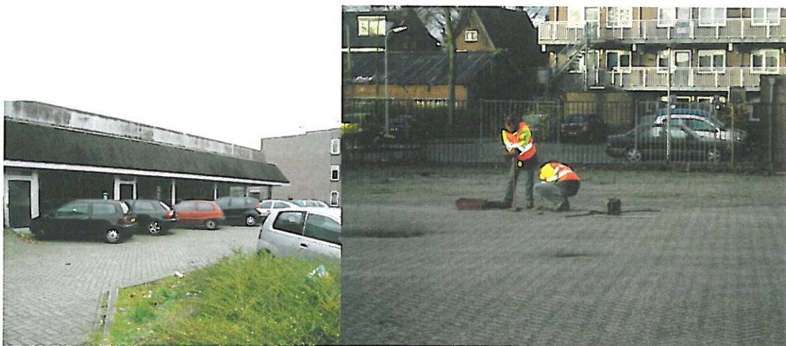
Figuur 9. Hoogeveen, Locatie 7 Schutstraat: foto's van de locatie. De linkerfoto is genomen vanuit de noordoostelijke hoek van het onderzoeksgebied in de richting van het noordwesten. Op deze foto is de bebouwing te zien. De rechterfoto is genomen vanuit het midden van het zuidelijke deel in de richting van het zuidwesten. Twee medewerkers van De Steekproef voeren een grondboring uit op dit terrein.

Locatie 7 ligt ten zuiden van de Schutstraat en ten oosten van de Van Limburg Stirumstraat. Het noordelijke deel van het perceel was ten tijde van het onderzoek bebouwd en de zuidelijke helft was bestraat (Figuur 9). De grootte van het terrein bedraagt circa 0,35 hectare.