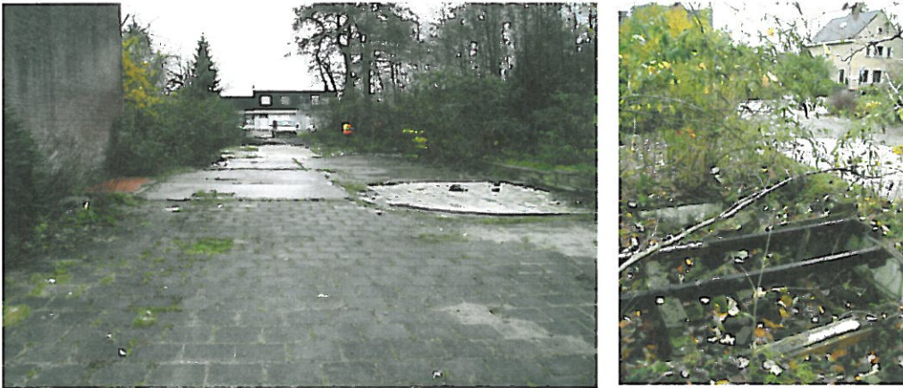
Figuur 3. Hoogeveen, Locatie 1 Stationsstraat: foto's van de locatie. De foto links is genomen vanaf het westen in de richting van het oosten. Er is nog een deel van een betegelde vloer zichtbaar en op de rechter foto is een gedeelte van een kelder te zien.

Locatie 1 Stationsstraat bevindt zich in het noorden van het plangebied. De zuidelijke begrenzing wordt gevormd door de Stationsstraat, de oostelijke grens is de Voltastraat en ten westen van de locatie loopt de Pesserstraat. Het terrein heeft een grootte van ongeveer 0,4 hectare en bestaat in het zuiden uit een strook met bomen en struiken. In het noordwestelijke deel heeft een gebouw gestaan, die ten tijde van het veldonderzoek reeds gesloopt was (zie Figuur 3). Een deel van de onderkeldering van het huis was nog zichtbaar.