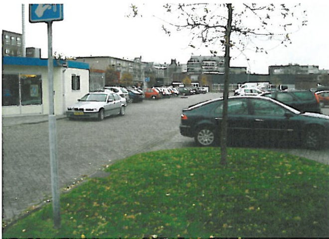
Figuur 7. Hoogeveen, Locatie 5 Beukemaplein: foto van de locatie, genomen vanaf het zuidwesten in de richting van het noordwesten.