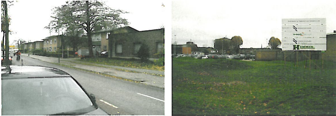
Figuur 6. Hoogeveen, Locatie 4 Kaapplein: foto's van de locatie. De linkerfoto is genomen vanaf het noordoosten in de richting van het zuidoosten. De rechterfoto is genomen vanaf de zuidoostelijke hoek van de locatie in de richting van het noordwesten. Op de voorgrond is het terrein van het gesloopte politiebureau te zien en op de achtergrond het parkeerterrein.