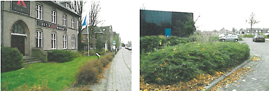
Figuur 4. Hoogeveen, Locatie 2 Brinkstraat: foto's van de locatie. De linkerfoto is genomen vanaf het noordwesten langs de Brinkstraat en de rechterfoto is genomen vanuit het zuiden naar het oosten. Het deel ter hoogte van de auto's hoort nog bij de locatie.

De tweede locatie, Brinkstraat, ligt ten zuiden van de Stationsstraat, aan de oostzijde van de Brinkstraat. Het terrein heeft een grootte van circa 0,4 hectare en is grotendeels bebouwd met een museum (zie Figuur 4).