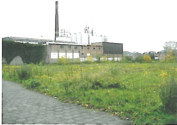
Figuur 8. Hoogeveen, Locatie 6 Alteveer: foto van de locatie, genomen vanaf het noordoosten in de richting van het zuidwesten. Het gebouw links staat op het zuidelijke deel van het terrein.