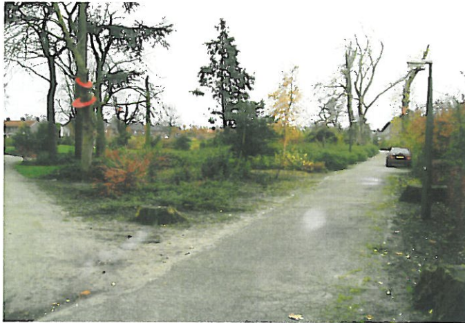
Figuur 5. Hoogeveen, Locatie 3 Park Dwingeland: foto van de locatie, genomen vanaf het noorden in de richting van het zuiden.

Locatie 3 beslaat ongeveer 4 hectare en ligt tussen de Benincklaan in het noorden en de Jonkheer de Jongstraat in het zuiden. De oostelijke begrenzing van de locatie wordt gevormd door de Notaris Mulderstraat. Ten westen van deze derde locatie loopt de Hoofdstraat. Het oostelijke deel van het terrein bestaat uit een park met kunstmatige hoogten (zie Figuur 5). Ten westen hiervan liggen enkele schoolgebouwen met daar achter het Stoekeplein. In het zuidwesten van de onderzoekslocatie staan enkele huizen.