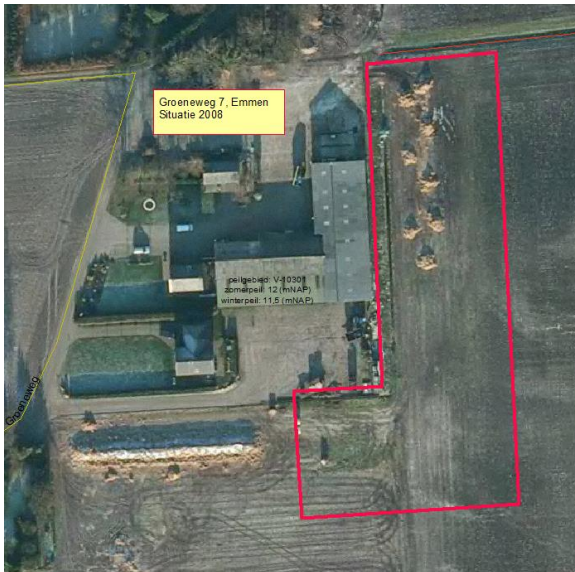
Erfsituatie 2008 Sloot oostzijde van het erf wordt gedempt.