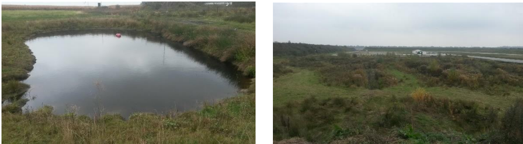
Figuur 3 Links een foto van de vijver in het plangebied. Rechts een overzichtsfoto van het plangebied met de crossbaan op de voorgrond en de gebouwen en het circuit op de achtergrond.

Op basis van de terreinkenmerken, de aangetroffen soorten en de potentie voor soorten, kan de natuurwaarde van het plangebied worden gekarakteriseerd als laag.