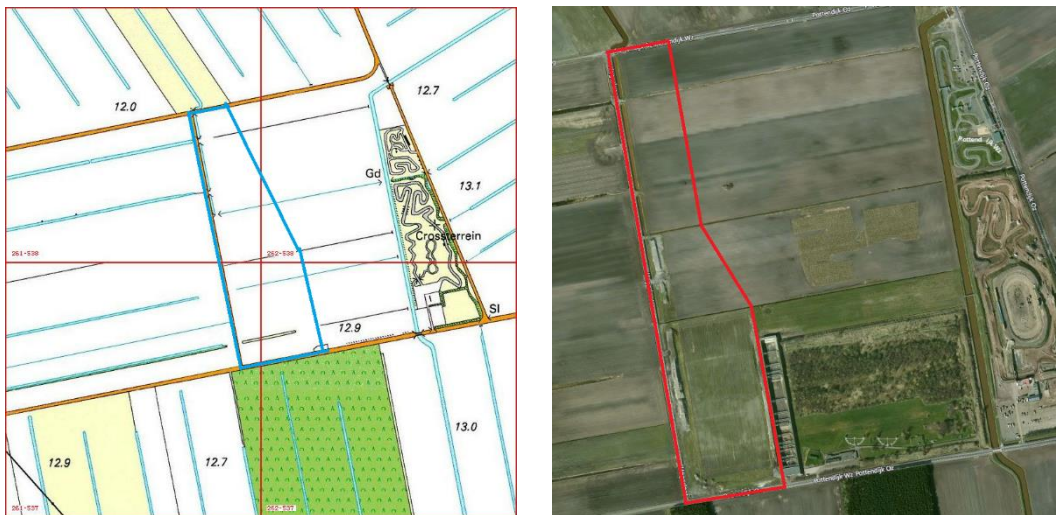
Figuur 1 Links de globale situering van het plangebied binnen de km-hokken (260-538, 260-537, 261-538 en 261-537). Rechts een luchtfoto met rood omlijnd het plangebied van circa 17 hectare.

Het plangebied bevindt zich binnen de kilometerhokken met de Amersfoort coördinaten 260-538, 260-537, 261-538 en 261-537 (Figuur 1). Een kilometerhok is een vastgelegd gebied van 1x1 km dat als standaard dient voor het inventariseren van de flora en fauna door de Particuliere Gegevensbeherende Organisaties (PGO's).