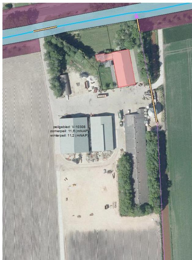
bestaande situatie (luchtfoto 2015)

Toename verharding in plangebied: 8.400 m 2