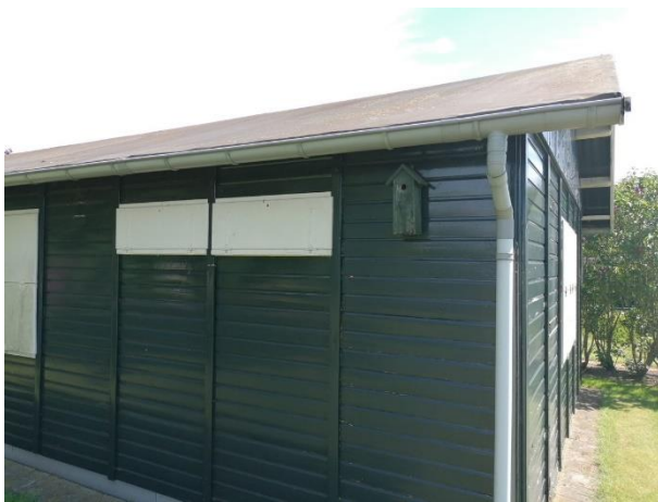
Deze nestkast biedt een potentiële nestplaats voor koolmees en pimpelmees.

Het plangebied behoort tot functioneel leefgebied van verschillende vogelsoorten. Vogels benutten het plangebied als foerageergebied en vermoedelijk nestelen er jaarlijks vogels in het plangebied. Vogels kunnen een nestlocatie bezetten in de beplanting en de nestkast aan de buitengevel van de noodwoning. De bebouwing beschikt niet over invliegopeningen en is daardoor niet toegankelijk voor vogels om in te gaan nestelen. Vogelsoorten die mogelijk in het plangebied nestelen zijn houtduif, koolmees, pimpelmees en vink. In het plangebied zijn geen aanwijzingen gevonden dat huismussen er een rust- of voortplantingsplaats bezetten. Tevens zijn er geen aanwijzingen gevonden dat roofvogels of uilen er een vaste rust- of voortplantingsplaats bezetten.