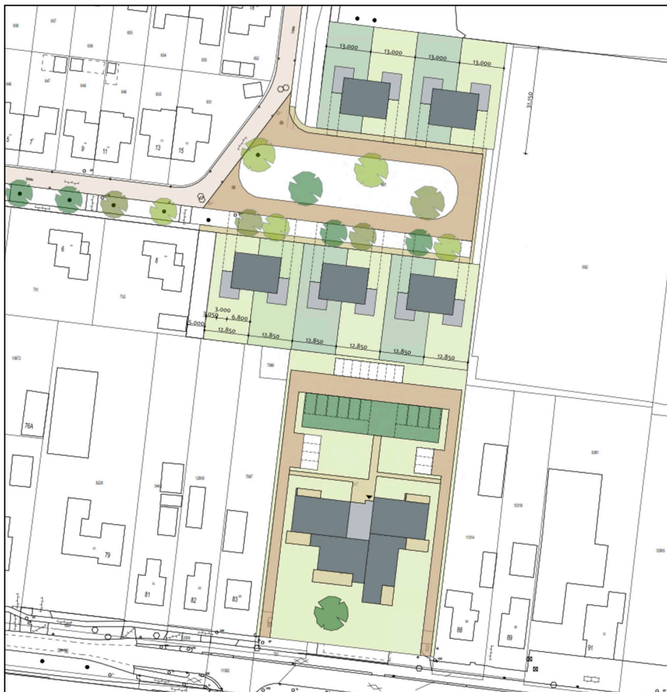
Afbeelding 2: Impressie inrichting van het projectgebied (Bron: CO Architecten)

Het voornemen heeft betrekking op een bedrijfslocatie aan de Vaart NZ 85 en de aansluitende groen- en verkeersbestemmingen. De bestaande bebouwing wordt vervangen door 10 twee-onder-een-kapwoningen en 10 appartementen. Tevens wordt een bestaand woonperceel (noordwesten projectgebied) vergroot en worden de bijbehorende voorzieningen aangebracht. In de volgende afbeelding is een impressie van de gewenste inrichting weergegeven.