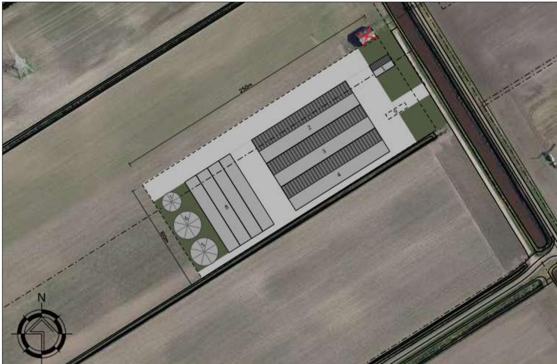
Verbeelding van het wenselijke eindbeeld (bron: VanWestreenen).

Er zijn concrete plannen voor de nieuwvestiging van een akkerbouwbedrijf. Het voornemen is om een bedrijfswoning, een werktuigenberging, overkapping en een loods voor de opslag van pootgoed te bouwen. Op het achtererf worden twee mestsilos en een watertank, evenals vier sleufsilos aangelegd. De veldschuur wordt gesloopt. Het nieuwe erf wordt nadien landschappelijk ingepast d.m.v. de aanplant van erfbeplanting. Op onderstaande afbeelding wordt het wenselijke eindbeeld weergegeven.