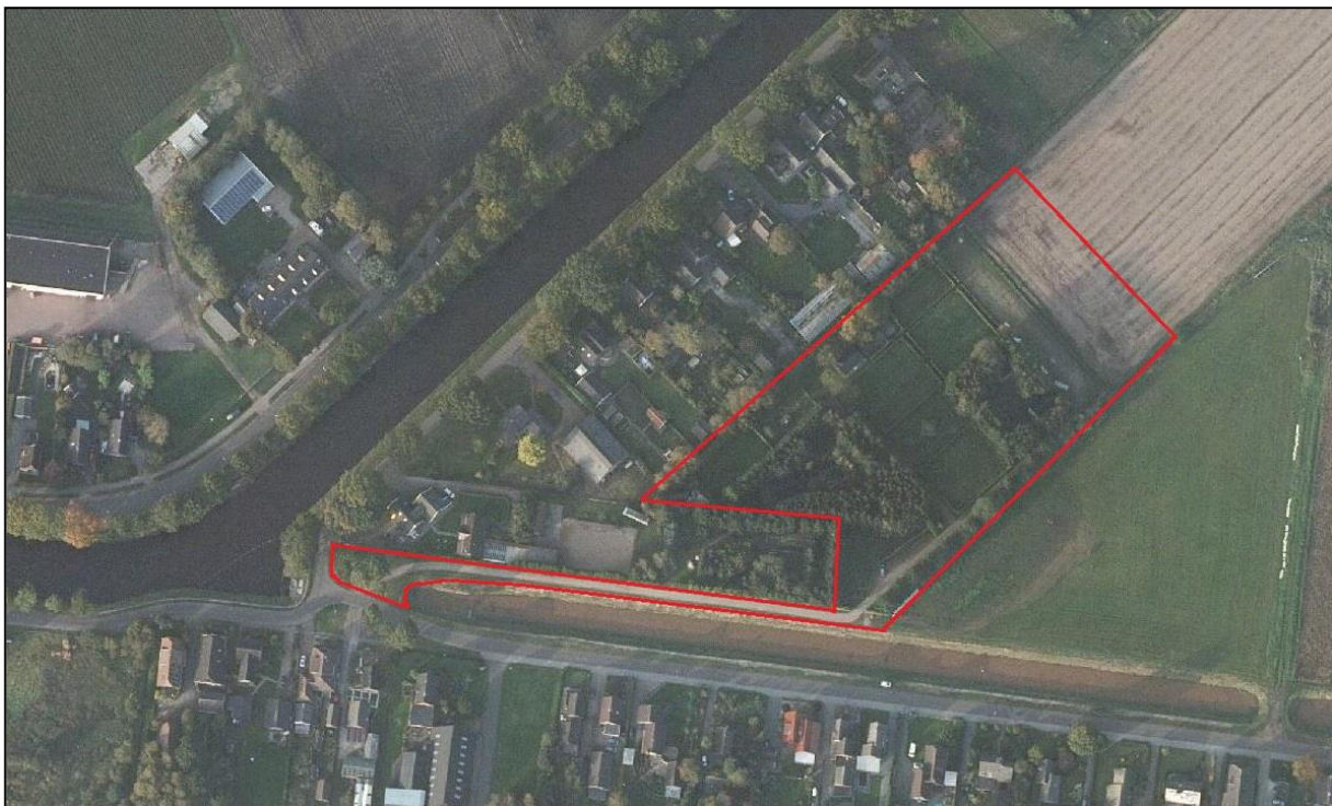
Figuur 2: Ligging plangebied meer in detail

Het plangebied is momenteel in gebruik als kampeerterrain met reeds 5 recreatiewoningen. Op het terrein zijn enkele bosjes aanwezig. Het terrein is overwegend onverhard. Op dit terrein zijn 2 boomhutten gerealiseerd en zijn en is de realisatie van nog 2 boomhutten reeds vergund. Het voornemen betreft een uitbreiding van het aantal recreatiewoningen alsmede het doorvoeren van onderschikte planologische wijzigingen betreffende de bedrijfswoning, het entreegebouw en het gebruik van een gebouw voor ondergeschikte horeca. Er worden maximaal 15 recreatiewoningen van maximaal 70 m 2 toegestaan. Het plangebied ligt in het stedelijk gebied. Uit gegevens van het Dinoloket blijkt dat de maaiveldhoogte van het terrein op circa 17,5 m +NAP ligt.