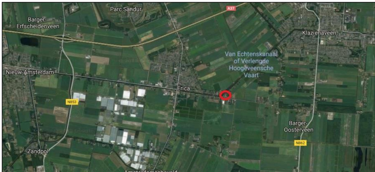
Figuur 1: Ligging plangebied in ruime context