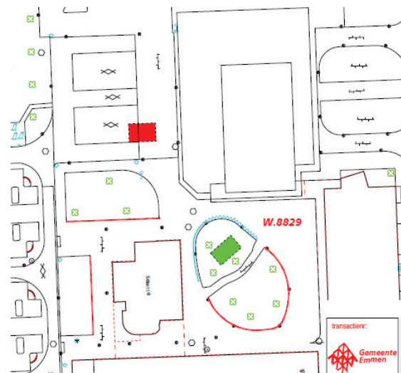
Situatie zoals opgenomen in ontwerpplan.