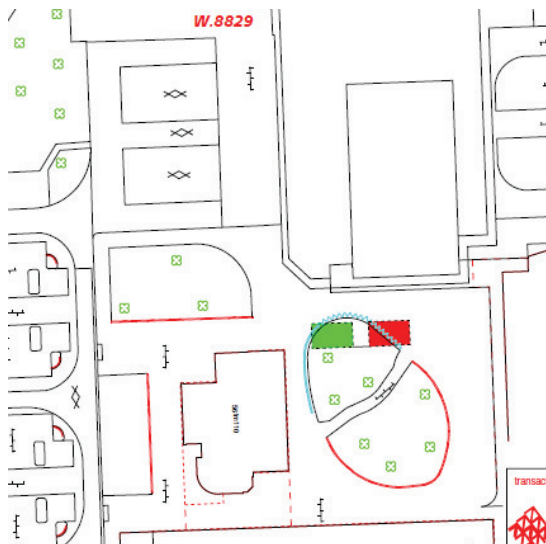
Afbeelding 1 Aangepaste situatie in nav zienswijze