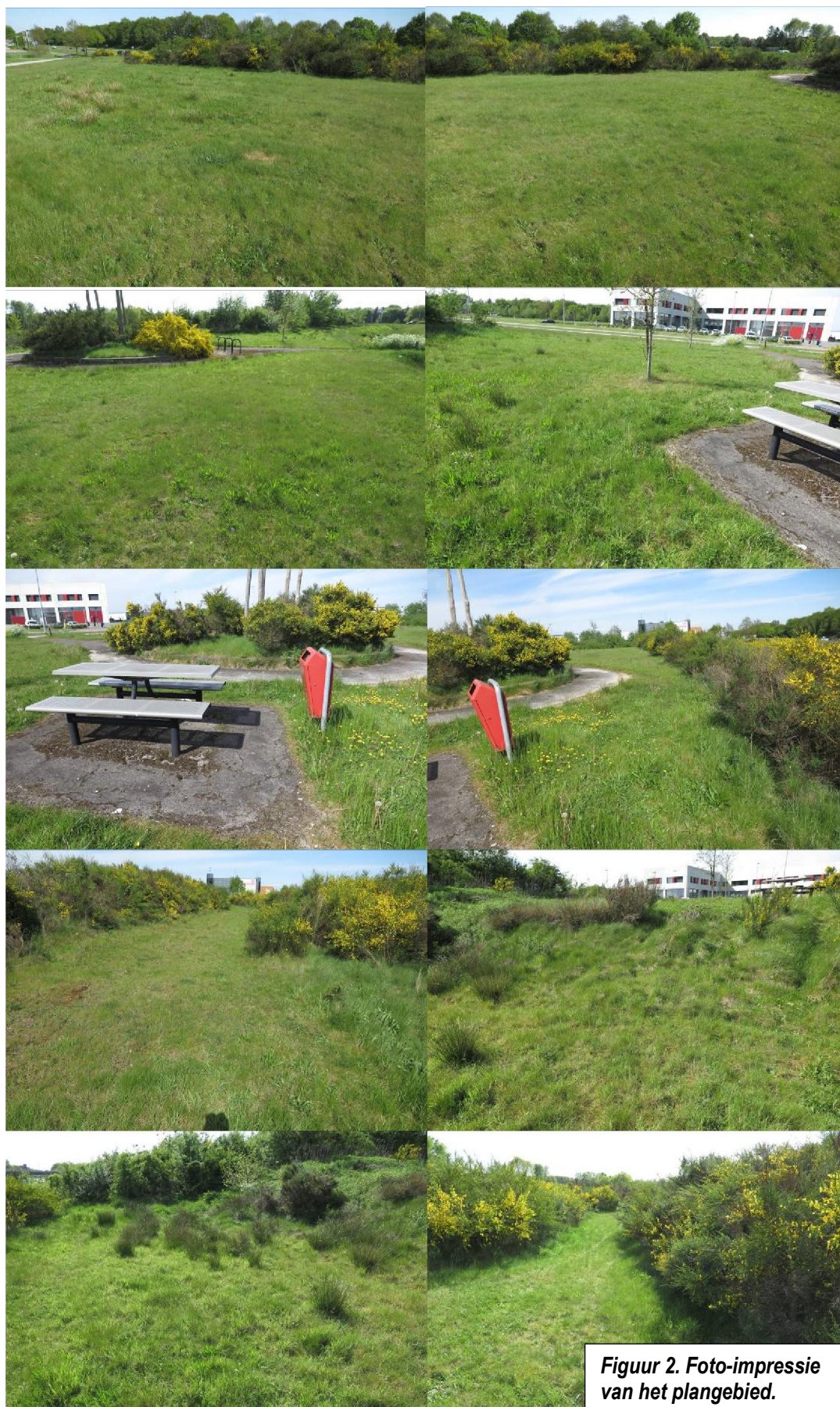
Figuur 2. Foto-impressie van het plangebied.