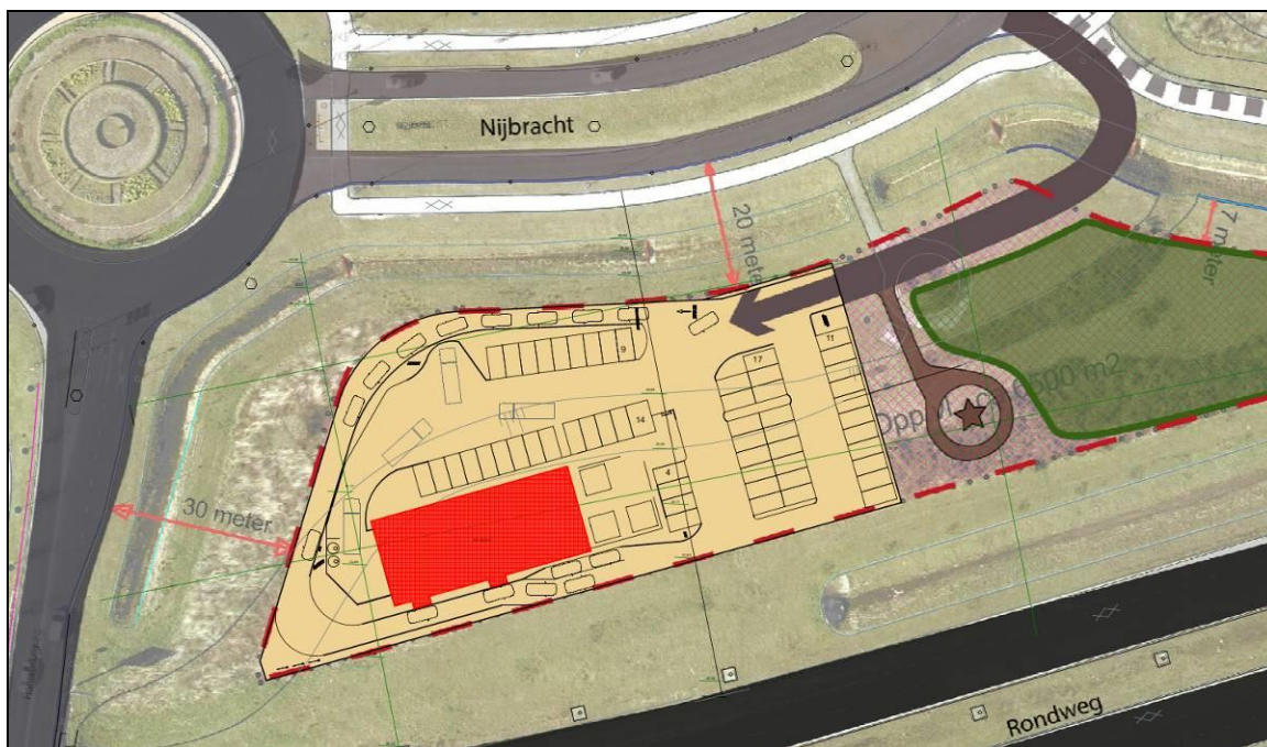
Figuur 3. Impressie van de plannen van Kentucky Fried Chicken aan de Nijbracht te Emmen.