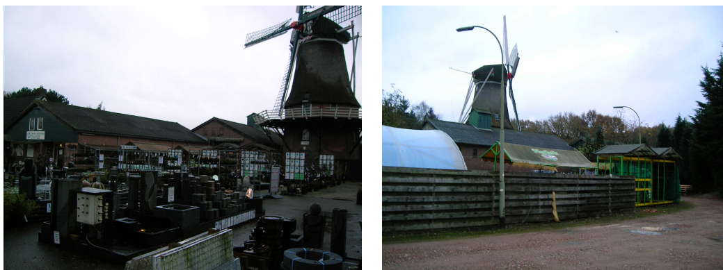
Figuur 2: Impressie van het plangebied.

Het plangebied bestaat voor het grootste deel uit bebouwing en verhard terrein. Centraal in het plangebied ligt molen Zeldenrust. Rondom de molen is het winkelpand en voorraadschuur van het tuincentrum gevestigd. Aan de westkant van de winkel staat een relatief nieuwe woning. Op het terrein zijn daarnaast diverse kleine schuurtjes en kassen aanwezig. Aan de randen van het gebied is opgaand groen aanwezig. Water ontbreekt in het plangebied.