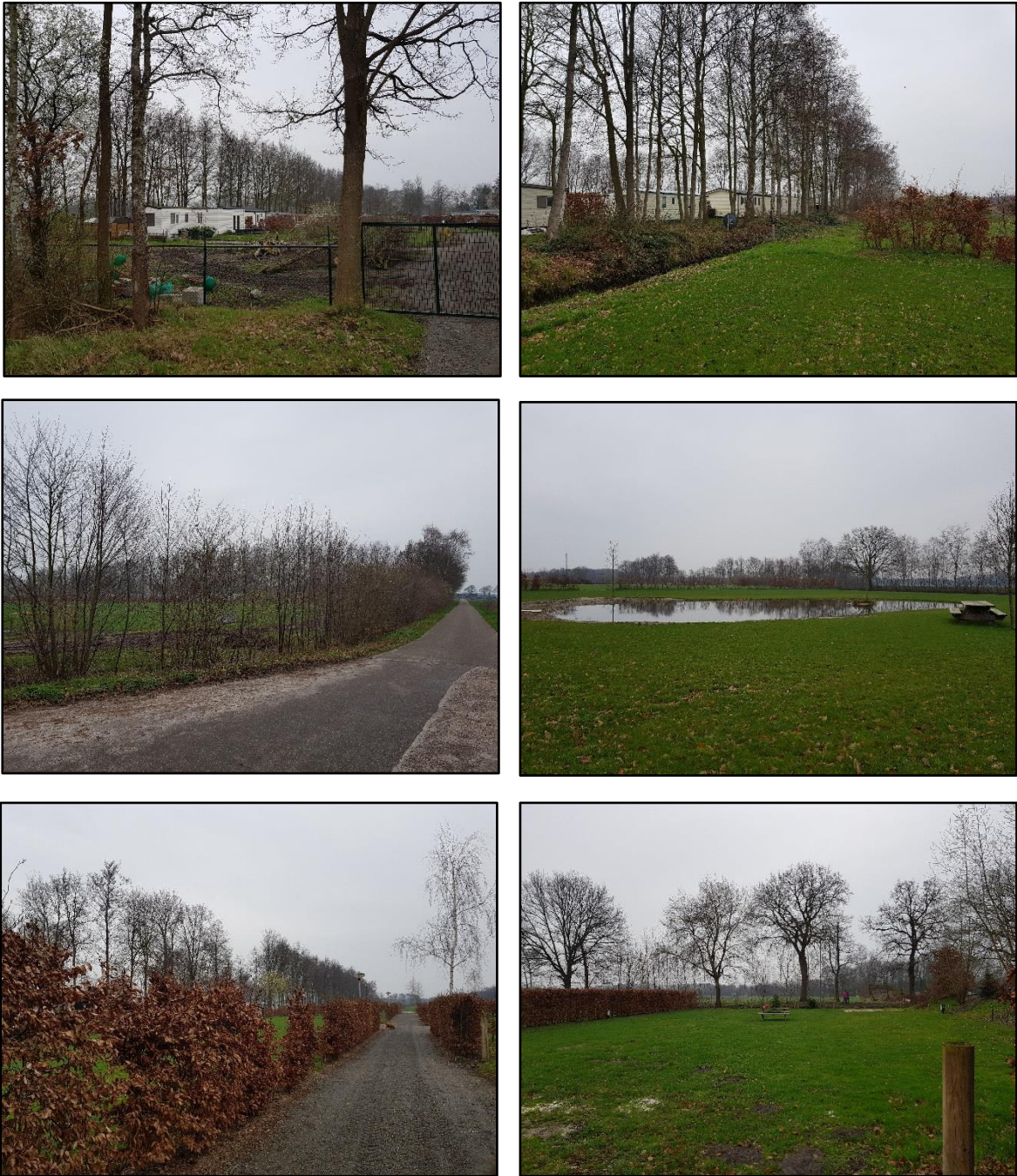
Figuur 4. Impressie plangebied, situatie op woensdag 20 maart 2019.