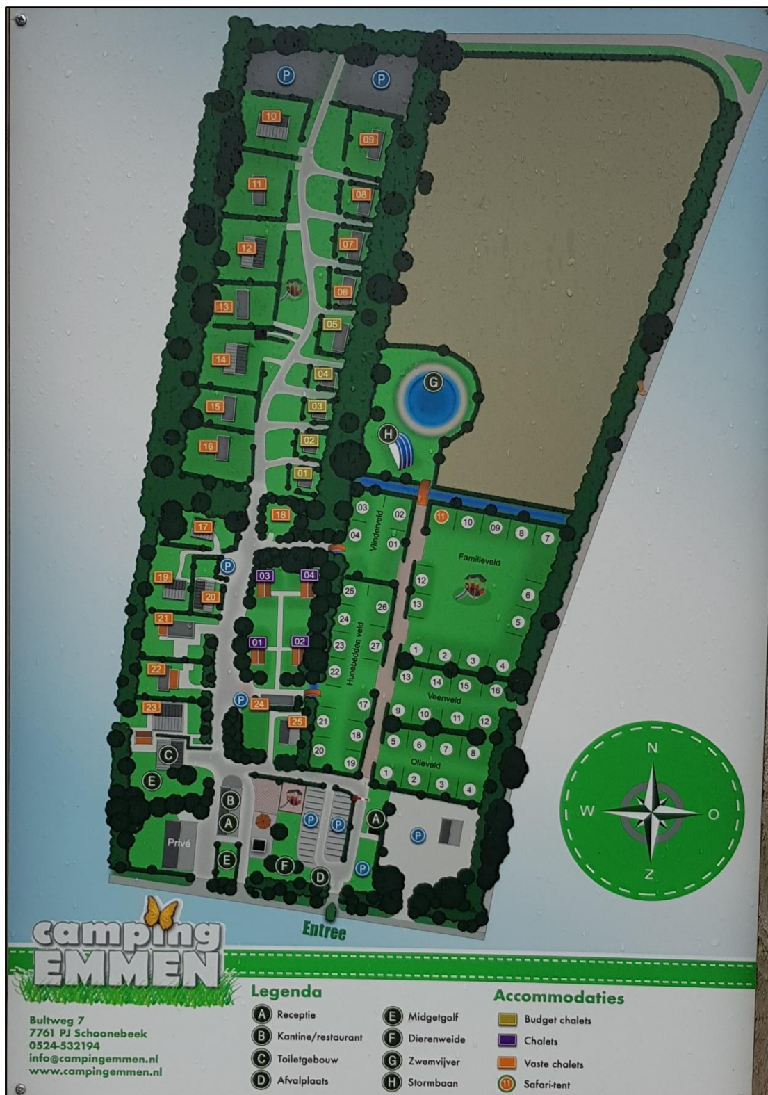
Figuur 3. Plattegrond Camping Emmen.