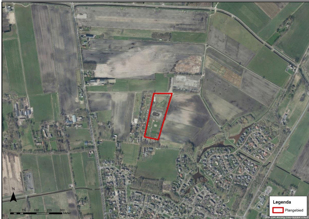
Figuur 1 en figuur 2. Ligging plangebied, rode arcering geeft het plangebied weer.