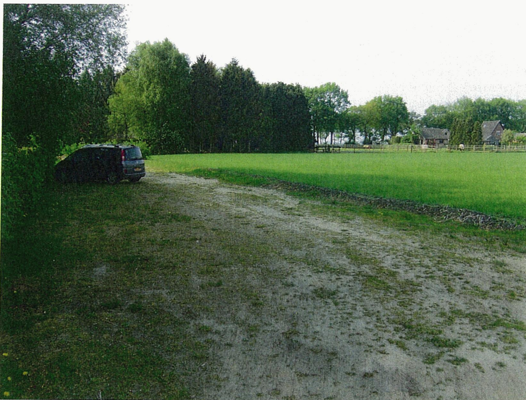
Figuur 2. Impressie uitbreidingslocatie (in noordelijke richting gezien).

Het onderzoeksgebied betreft een deel van een agrarisch perceel, waar voorheen bieten/aardappels werden verbouwd en nu is ingezaaid met gras. Aan de westkant ligt een onverharde parkeergelegenheid dat tot de uitbreidingslocatie behoort en zal worden heringericht. In het onderzoeksgebied is geen opgaand groen en oppervlaktewater aanwezig. Grenzend aan de zuidoostzijde van het perceel loopt een smalle singel. Aan de noord- en zuidzijde wordt het perceel begrensd door smalle greppels die niet jaarrond watervoerend zijn.