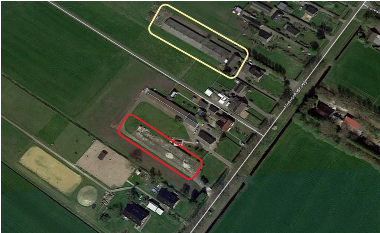
Figuur 3: Close up van onderzochte locatie.