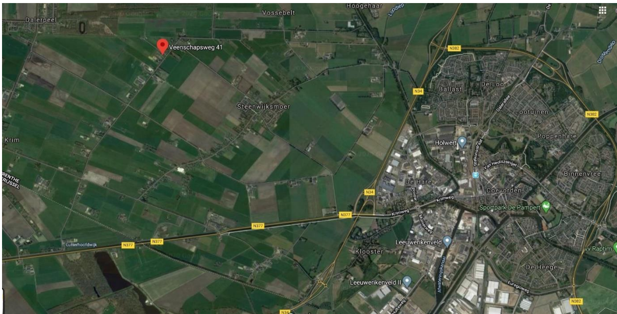
Figuur 2: Ligging van de onderzochte locatie.

De onderzochte locaties bevinden zich aan de Veenschapsweg 41 en 59. Aan Veenschapsweg 41 (figuur 3 rood omkaderd) betreft het een braakliggend terrein waar ooit een kippenschuur heeft gestaan. Nu is er slechts sprake van een betonnen vloer. Aan Veenschapsweg 59 (figuur 3 geel omkaderd) betreft het een oude kippenschuur. Deze schuur staat inmiddels een jaar op 5 leeg. De schuur is van oorsprong gebouwd met houten wanden op een bakstenen ondermuur. Voor en achterzijde bestaan uit bakstenen muren. De houten wanden zijn later aan de buitenzijde afgetimmerd met damwandprofielplaten. Het dak bestaat uit golfplaten welke overal naadloos op elkaar aansluiten. Aan de binnenzijde is de kippenschuur nog geheel in oude staat. Dat wil zeggen: alle voorzieningen behorend bij een kippenhouderij zijn nog aanwezig. Voor een impressie van de onderzochte locatie: Zie fotobijlage.