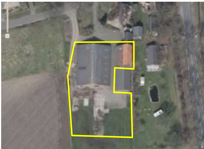
Detailopname van het plangebied. De begrenzing van het plangebied wordt met de gele lijn aangeduid.

Het plangebied vormt een deel van een agrarisch erf en bestaat uit bebouwing, erfverharding en grasland. In het plangebied staan een ligboxenstal en een schuur. Beide gebouwen zijn gebouwd van bakstenen, waarbij alleen de ligboxenstal over een spouwmuur beschikt. De ligboxenstal is gedekt met golfplaten en is voorzien van dakisolatie in de vorm van pirplaten. De schuur is gedeeltelijk gedekt met golfplaten en gedeeltelijk met dakpannen en beschikt niet over dakisolatie. De staat van onderhoud van de gebouwen is goed; beide gebouwen zijn wind- en waterdicht. De gebouwen stonden tijdens het veldbezoek leeg. Rondom de gebouwen ligt erfverharding en grasland. Het grasland bestaat uit een soortenarme vegetatie van hoofdzakelijk raaigras en wordt intensief beheerd. Op onderstaande luchtfoto wordt het plangebied in detail weergegeven, evenals de begrenzing. Voor een impressie van het plangebied wordt verwezen naar de fotobijlage.