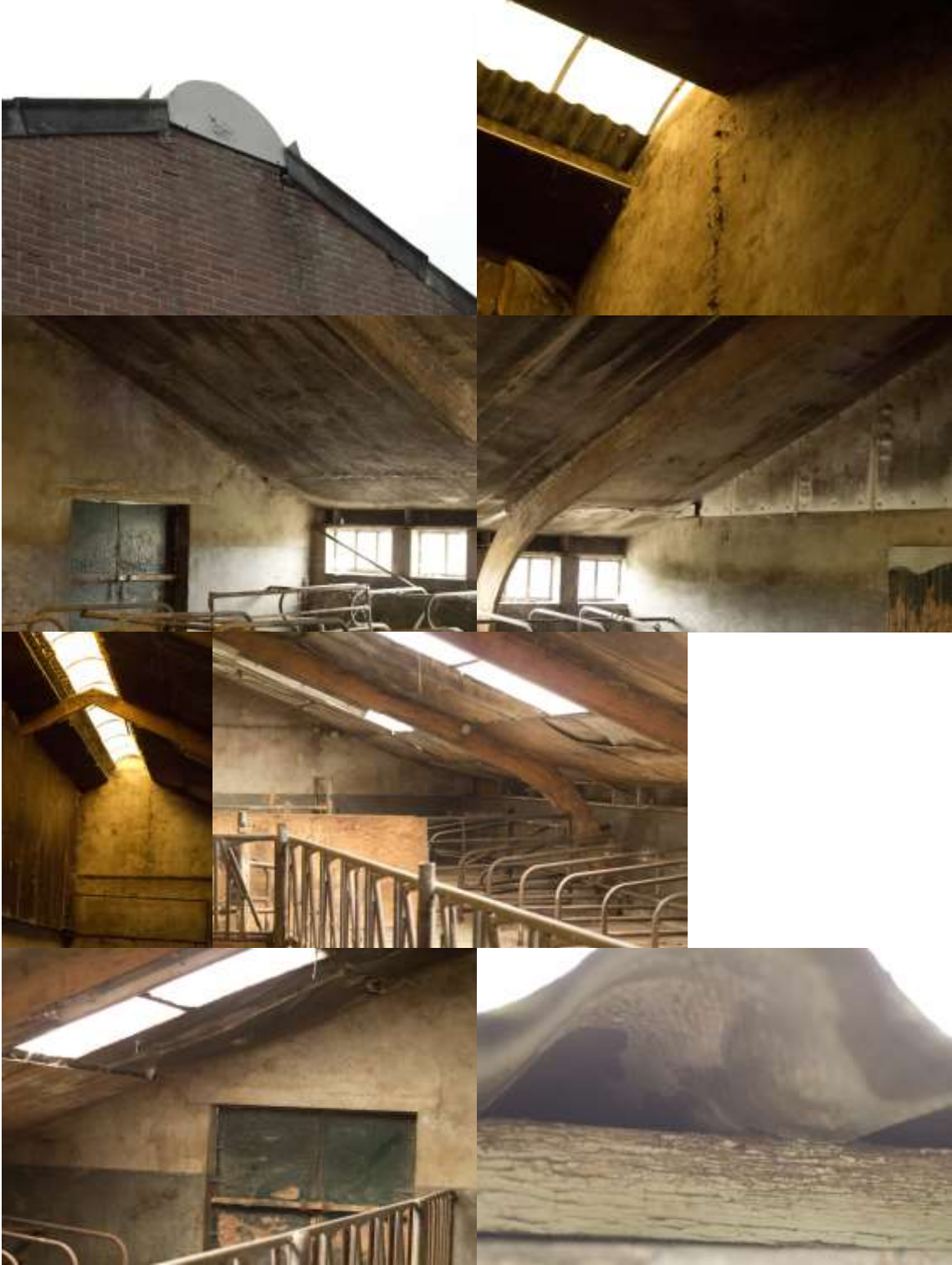
Bijlage 3. Fotobijlage. Impressie van het plangebied en de directe omgeving.