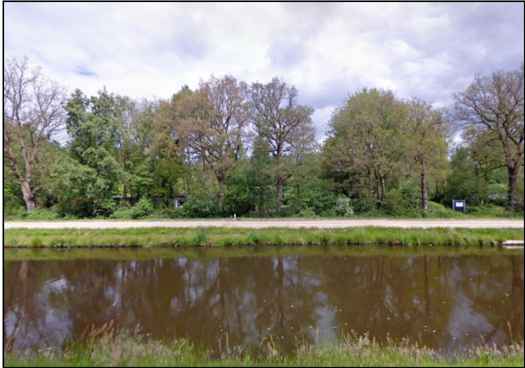
Zicht op het terrein van de Wolfskuylen vanaf de Hoogeveensevaart (zuidkant)