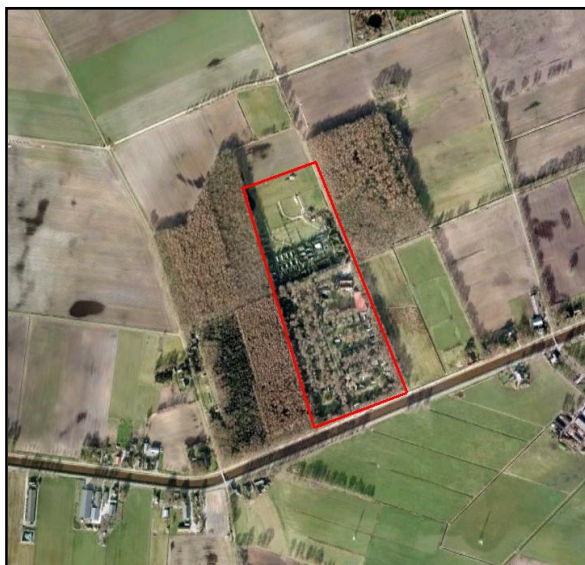
Omgeving plangebied

Het plangebied is gelegen in de gemeente Coevorden, ten zuiden van de kern Gees. Ten westen en oosten van het plangebied liggen bospercelen. Aan de noord- en zuidkant ligt agrarisch akker- en grasland. Aan de zuidkant wordt het plangebied begrenst door de Hoogeveense Vaart.