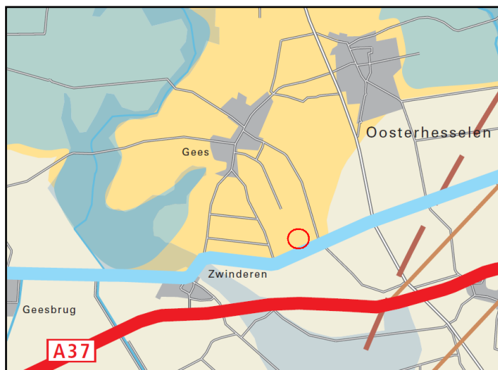
Uitsnede omgevingsvisie

De Omgevingsvisie beschrijft de ruimtelijk-economische ontwikkeling van Drenthe voor de periode tot 2020, met in sommige gevallen een doorkijk naar de periode daarna. De missie van de provincie is het koesteren van de Drentse kernkwaliteiten en het ontwikkelen van een bruisend Drenthe, passend bij deze kernkwaliteiten.