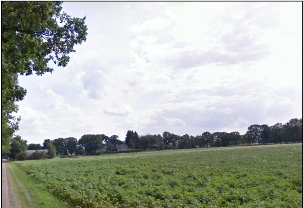
Landschap ten oosten van 'De Wolfskuylen'

Het plangebied maakt deel uit van de gemeente Coevorden en is ingedeeld bij de kern Gees. Deze kern ligt ten noorden van het plangebied. Het plangebied is gelegen aan de Verlengde Hoozeveense Vaart. In de omgeving van het plangebied liggen afgewisseld bospercelen en agrarische gronden. De bospercelen behoren niet tot de EHS. De omgeving van het plangebied bestaat uit een jong ontginningslandschap met grote vierkante kavels, weinig bebouwing en rechte wegen. Op onderstaande foto is het landschap in de omgeving zichtbaar.